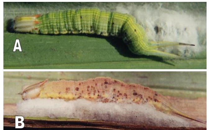
Figura 2. A y B: Larva del V instar de Opsiphanes cassina Felder parasitada por Cotesia sp.

Durante todo el año de evaluaciones, en la hoja N° 25, se encontró adultos, ninfas –las ninfas se incluyeron junto con los adultos, en una única cuantificación– y posturas de un chinche depredador no identificado perteneciente a la familia Reduviidae, al detectarse los adultos aparecen sus posturas (Figura 1D), aunque sin causar depredación a O. cassina . También se capturó, en una oportunidad, un ejemplar de Arilus cristatus L. (Reduviidae). Varias especies de chinches pentatómidos son mencionadas como depredadoras muy eficientes de larvas y pupas de O. cassina (Mexzón y Chinchilla, 1996, Chinchilla, 2003). De manera similar, Pastrana et al. (2019), señalan a los depredadores Alcaeorrhynchus grandis , Podisus sp. y tres individuos del orden Araneae ejerciendo depredación del 3,52% en larvas, pupas y adultos de O. cassina .