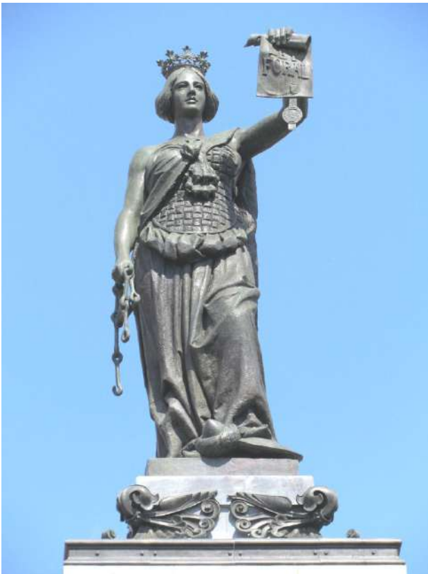
La Matrona Foral del Monumento.