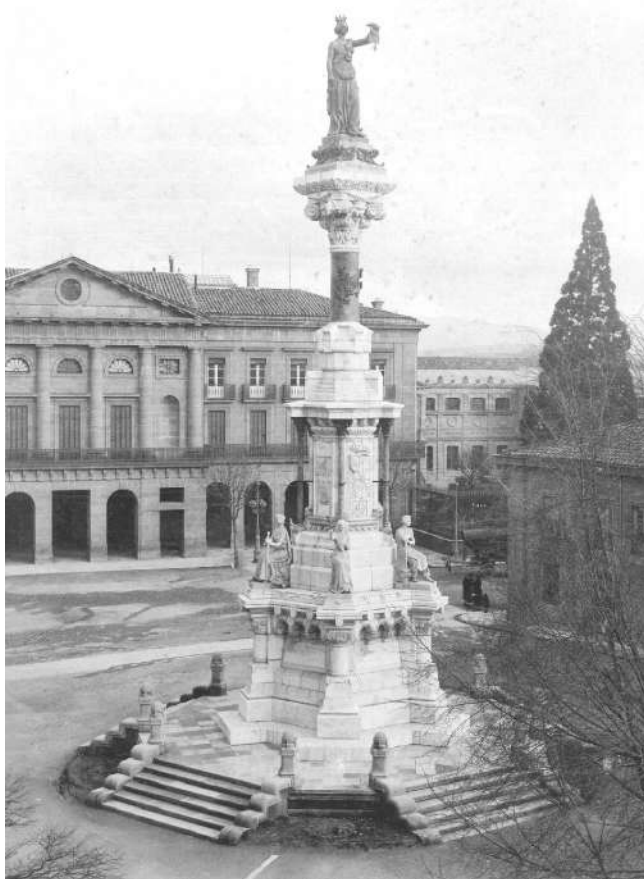
El Monumento hacia 1903, sin las placas.