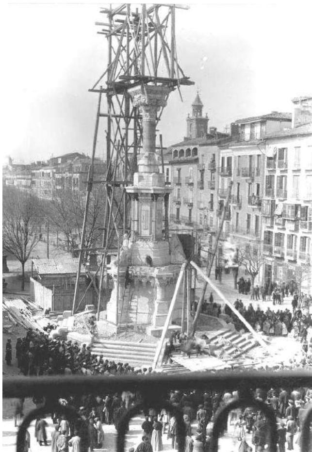
Construcción de monumento a los Fueros.