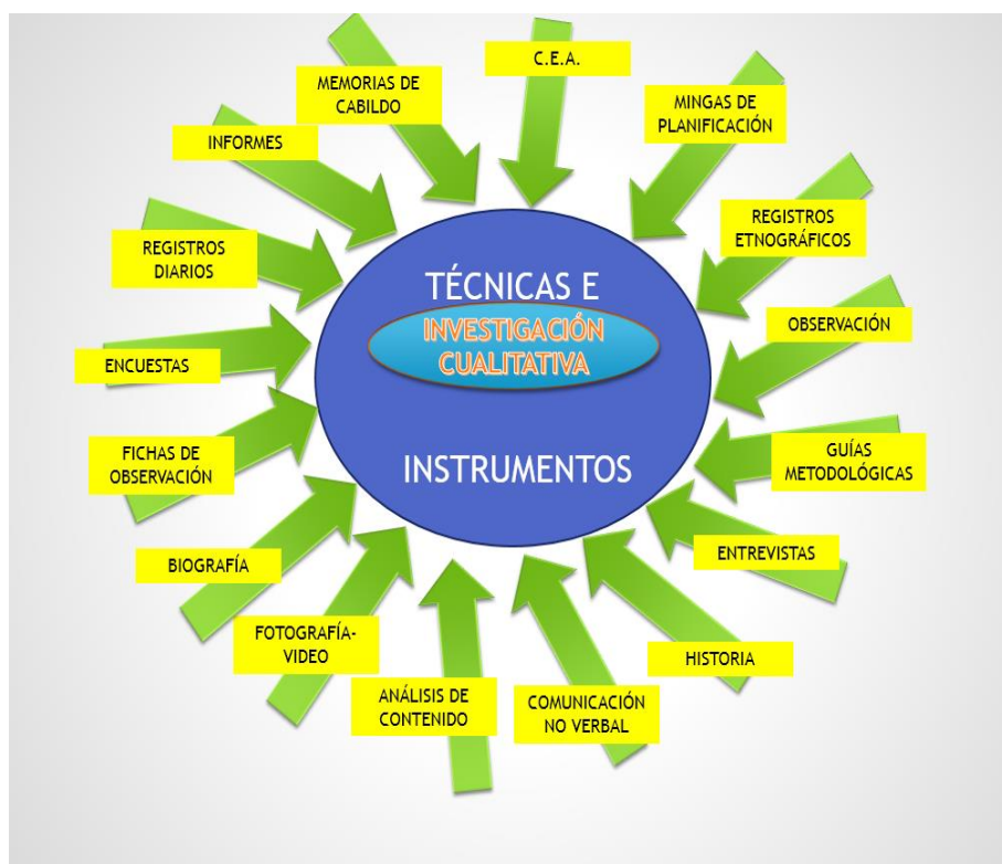
Figura 2. Técnicas e instrumentos investigación cualitativa.

El paradigma cualitativo de los procesos rigurosos de investigación requiere acoger técnicas e instrumentos que pueden generar una metodología de trabajo académico, que se sustente en el conocimiento ancestral, científico y en la práctica real, motivando, a su vez, la innovación continua de los procesos de desarrollo social comunitario. Entonces, una vez que se ha pragmatizado