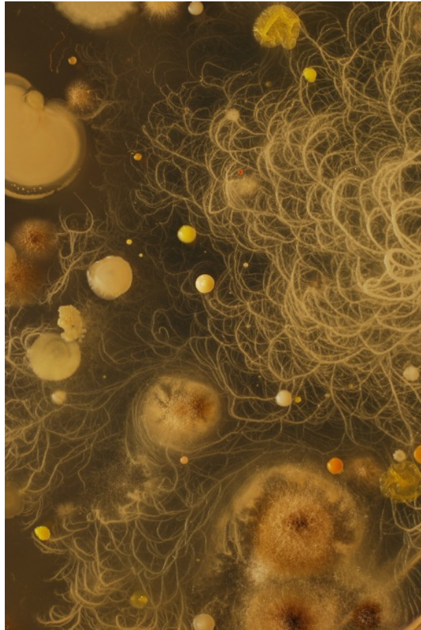
Figura 3. Mauro (s/f), serie "Retratos", Luciana Paoletti.

tradición visual a la que comenta, con un procedimiento muy particular: el cultivo microbiano (figura 3).