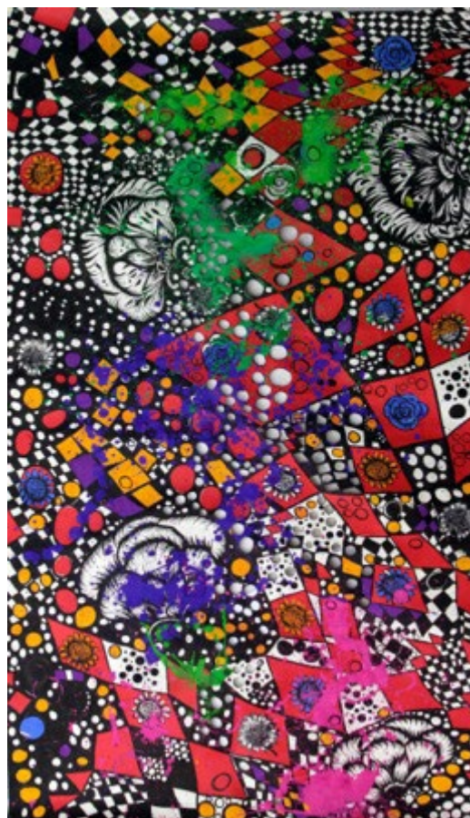
Figura 8. Conexiones botánicas en galaxias lejanas , 2015. Tinta, gouache y collage sobre papel calado. 1,90 x 1,06m.