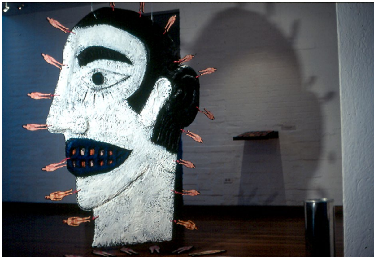
Figura 2. La Diosa, 1997. Papel maché sobre madera. 1,60 x 1,20 m. Parte de la exhibición Valientes hombres de mi Patria.