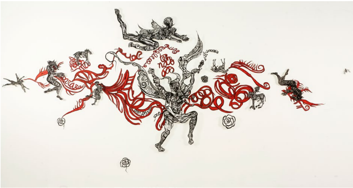
Figura 5. La Procesión, 2014-2016. Instalación de dibujo a tinta y gouache sobre papel recortado. Dimensiones variables.