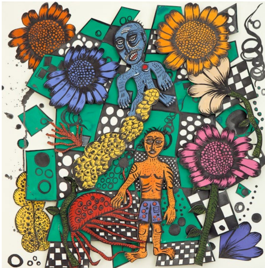
Figura 6. Jardín del pulpo , 2011. Gouache y collage sobre papel recortado. 50 x 50 cm.