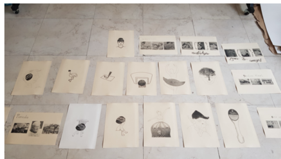
Figura 7 y 8. Reinaldo Rodríguez, custodio del Archivo El Telégrafo, mostrando ejemplares e ilustraciones hechas por los talleristas que guio el artista Javier Pérez.