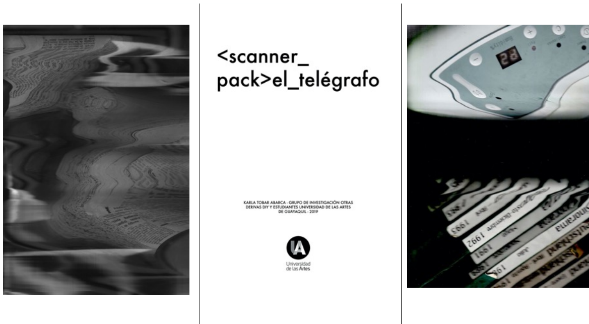
Figura 5 y 6. Páginas del libro colaborativo que resultó del taller con la artista Karla Tobar donde usamos un dispositivo óptico para intervenir el Archivo El Telégrafo.