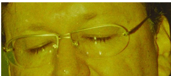
Figura 10. Detalle de obra "Ojos Cerrados", imagen de Marco Vinicio Ruiz, presidente del Consejo Nacional Empresarial para el Tratado de Libre Comercio Centroamérica-Estados Unidos. Tomada el 11 de julio de 2004.

"Ojos cerrados" es una serie de 50 fotografías de 25 x 11 centímetros. A través de la digitalización de los negativos de la caja "Varios 1" (figura 10). C, que contiene imágenes del acontecer político, social y cultural de Guayaquil y del país, se cuestiona la importancia que tiene la imagen a la hora de contar una historia. En las imágenes solo podemos ver los "ojos" de quienes están retratados por lo que se nos habla de la información faltante en el Archivo, de las historias incompletas. Al mismo tiempo los ojos cerrados son un guiño simbólico de esa realidad que no se quiere ver, de la ausencia, de la poca visibilidad y del no reconocimiento de nuestro pasado en una ciudad que le ha dado la espalda a su memoria y en donde el vacío de políticas institucionales marca nuestro presente y futuro.