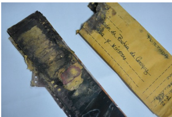
Figura 9. Material damnificado por circunstancias fortuitas en las instalaciones del Archivo El Telégrafo.

“Serie Desastres Naturales” analiza la visualidad y la pérdida de información de los negativos, los cuales pasan a ser un testimonio material del transcurrir. La “preservación histórica” que es uno de los objetivos del Archivo El Telégrafo queda supeditado a la realidad de desvanecimiento de la “memoria” debido a los fortuitos “desastres” que ha sufrido a lo largo del tiempo (figura 9). Durante la investigación se evidenció que muchos de los negativos que sufrieron daños pertenecen a la categoría “Desastres Naturales”. La obra está compuesta de diversas cajas de luz con un sistema lumínico programado y reactivo al tránsito del público, que mostrará y ocultará una selección de negativos e imágenes digitalizadas que aluden a varias catástrofes que ha atravesado el Ecuador durante la década de los noventa y dos mil.