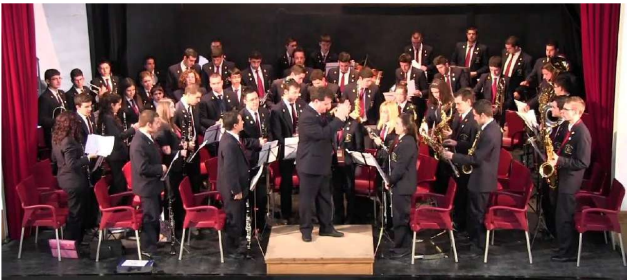
Banda de música de Tudela en el año 2020.