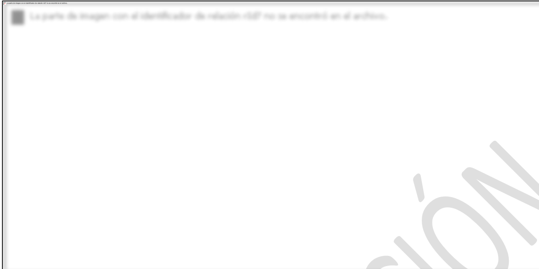
Figura 2. Niveles de planeamiento estratégico en Perú