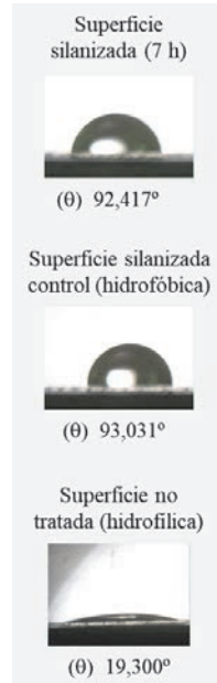
Figura 3. Fotografías y valores de ángulos de contacto de referencia de una gota de agua bidestilada depositada en superficie obtenida en este trabajo: superficie silanizada 7h, control y superficie hidrofílica. El ángulo de contacto ( \theta ) se muestra en grados ^\circ

Los resultados indican que la eliminación de residuos orgánicos, combinando luz UV de \lambda de 253,7 y 180 nm simultáneamente, mejora la hidrofobicidad de las superficies obtenidas en aproximadamente 3^\circ (Tablas 1 y 2, 7 horas de exposición). Finalmente es recomendable eliminar el exceso de silano con la ayuda de ultrasonidos en presencia de n-heptano/cloroformo. Estas condiciones de trabajo permiten obtener superficies hidrofóbicas con un ángulo de contacto ( \lambda ) superior a 90^\circ .