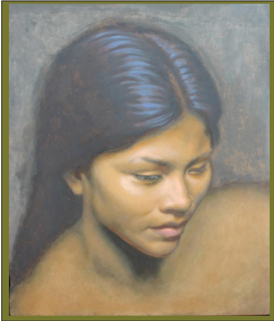
Borita. Óleo sobre madera 36 X 40 cm. David Hewson (EEUU, 1966) www.davidhewsonart.com