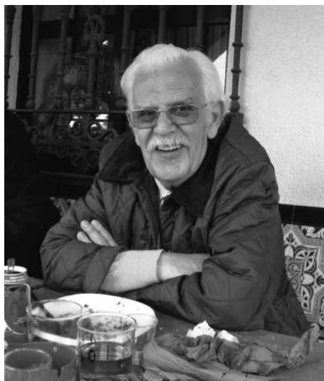
Comida con la Económica en 2010