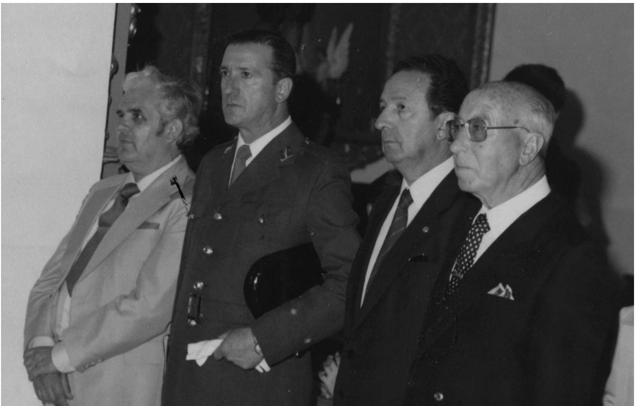
En su destino de Villanueva del Fresno (Badajoz)

Sin embargo su destino definitivo fue Villanueva del Fresno (Badajoz). Optó a una vacante de comisario jefe del puesto de frontera en aquella localidad, que había quedado vacante por fallecimiento de su titular, y que era una plaza de libre designación. Se la concedieron en el año 1979 y desde entonces el matrimonio residió en aquella bonita localidad pacense, hasta que en 1995 se trasladaron definitivamente a la ciudad de Badajoz. Allí, en Villanueva del Fresno, primero vivieron durante 4 años en la frontera y el resto del tiempo, en un piso que adquirieron en la misma localidad. Fueron años muy felices para el matrimonio, perfectamente integrado en la sociedad de Villanueva del Fresno y con numerosos amigos.