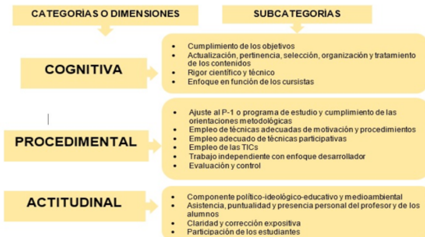
Figura 2. Sistema de categorías y subcategorías para la evaluación de las diferentes formas organizativas