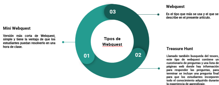
Figura 1. Tipos de WebQuest.

Esta e-actividad, además permite motivar y guiar el trabajo investigador del estudiante, y la consecución de los aprendizajes con la participación activa del estudiante (Ulu y Ulusoy, 2019); asimismo, propicia el uso de recursos Web fáciles de utilizar por lo que no necesariamente requieren del acompañamiento del docente. En la Figura 1 se muestran diversos tipos de WebQuest que se pueden seleccionar de acuerdo al interés y temática que tenga planificada el docente (Martínez y Déniz, 2018).