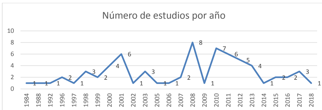
Gráfico 1. Número de estudios por año

A partir del nuevo siglo, el campo empieza a fortalecerse realizándose al menos un estudio por año, excepto en el año 2004 en el que no parece haber ningún estudio. Como años con mayor número de estudios encontramos los años 2001, 2008, 2010 y 2011, con el año 2008 como repunte con ocho estudios constatados. Repasaremos a continuación los estudios de doctorado y disertaciones de máster realizados por continentes, pudiendo observar que Oceanía y Asia son los continentes con menos estudios realizados. En la Tabla 1 podemos ver el número de estudios por continentes que pasaremos a detallar a continuación.