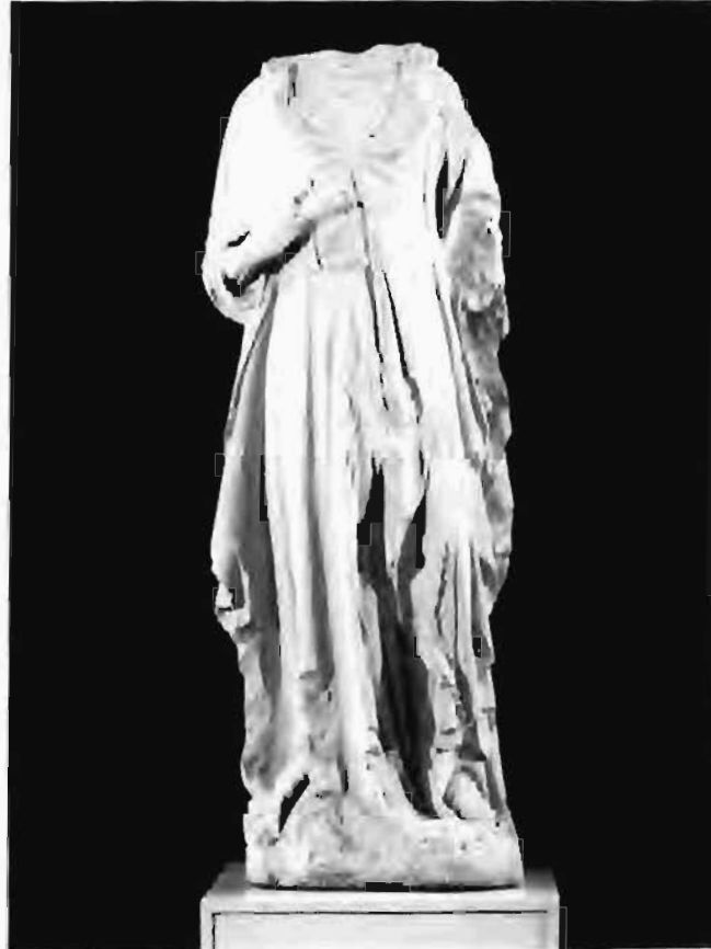
Imatge núm. 2

actitud d'ofrena), descansa sobre el pit; probablement la mà esquerra tindria una posició similar, característica de les imatges amb l'advocació proposada (6) .