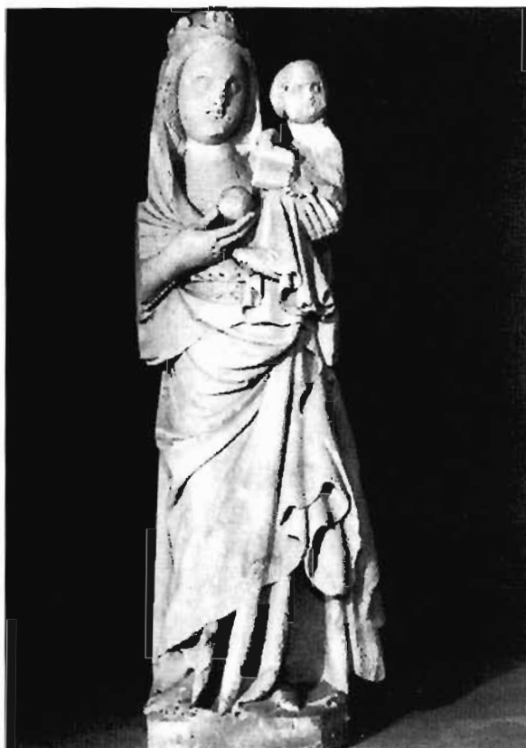
Imatge núm. 3