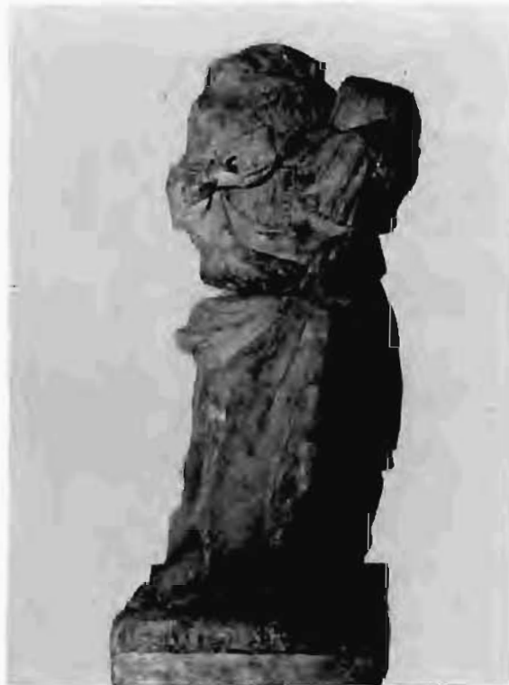
Imatge núm. 4

Peça trencada en dos fragments: l'inferior fa una mica més de 40 cm d'altura i el superior una mica més de 30 cm (la fractura és irregular). A més a més, li falten els caps de la Mare de Déu i del Nen (molt malmès) i presenta molts cops i erosions per-