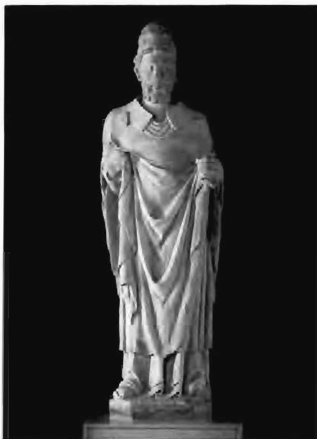
Imatge núm. 1

Escultura que representa molt probablement el primer Papa, Sant Pere, vestit amb els seus atributs pontificals, dels quals destaca la tiara de tres corones sobrepasades (no s'aprecien, a causa de l'erosió, la creu que encapçalaria el capell pontifici ni les dues infules que penjarien en la part inferior). Com a element característic, la imatge porta en la seva mà esquerra una clau, molt malmesa però identificable per comparació amb altres escultures similars (4) .