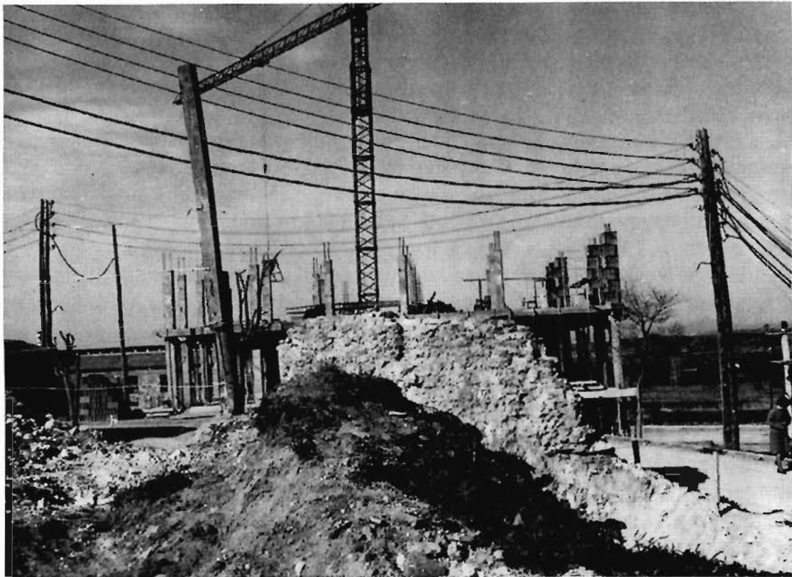
"El Morrot", restos de la primitiva església de Constantí

tado de clasificarlas: algunos han dicho que pudieran ser bizantinas de los primeros siglos; otros que del siglo X, y algunos han llegado á clasificarlas como del XVI. Creo que para estas apreciaciones no ha presidido una suficiente observación.