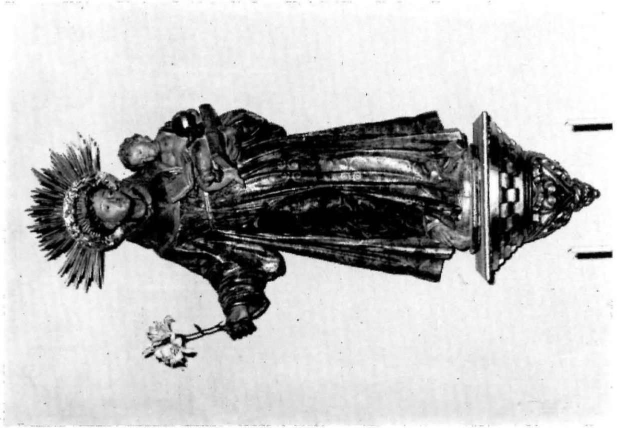
Retale de Sant Antoni, J. Espinalt