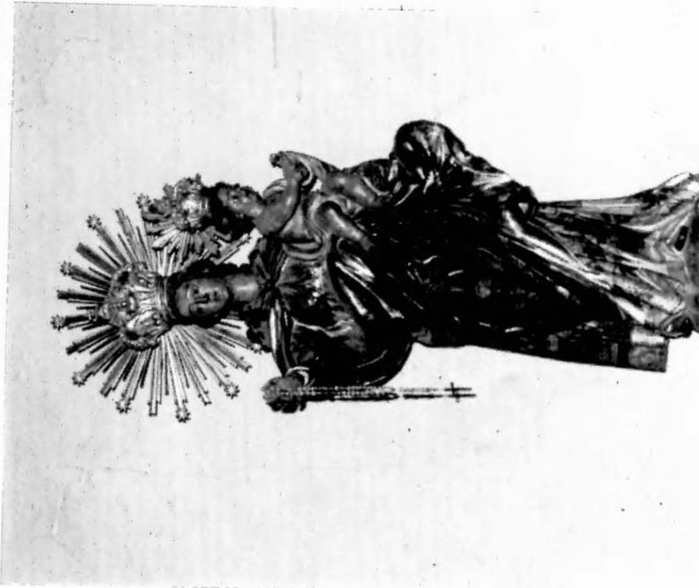
Verge del Roser, Guardia G., 1774