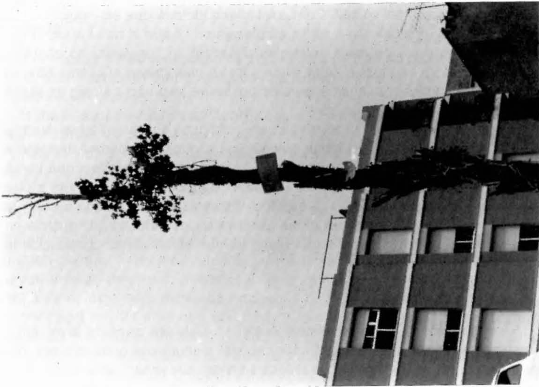
Festa dels Quintos. "El maig"