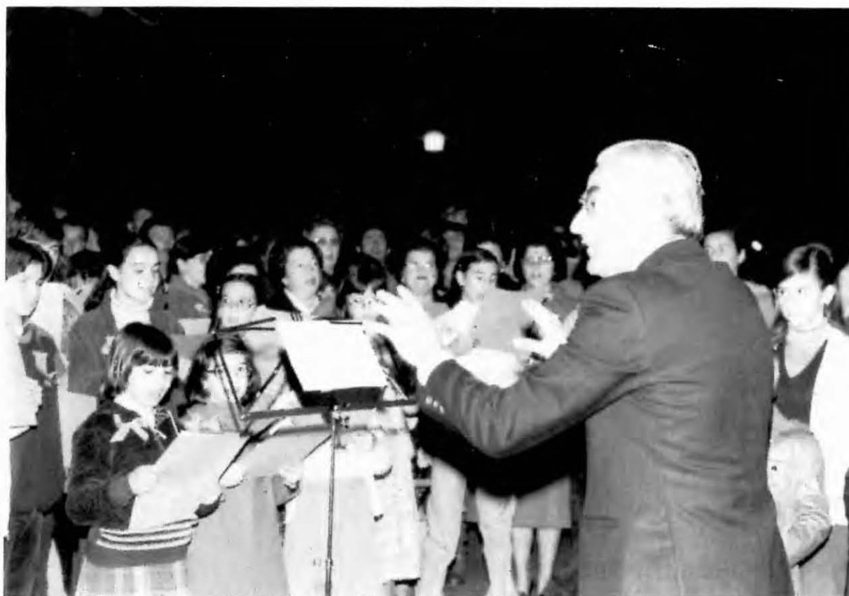
Dissabte Sant. Les Caramelles