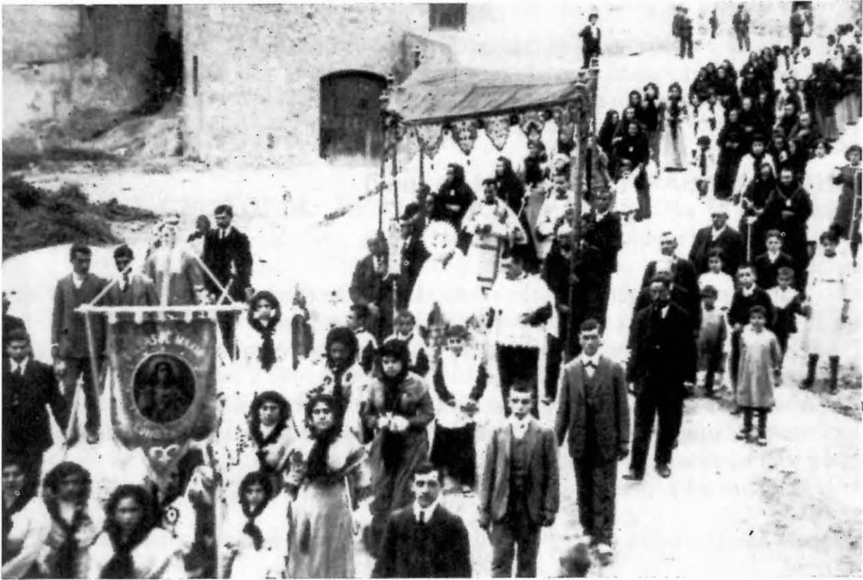
Processó de Corpus (antic recorregut)