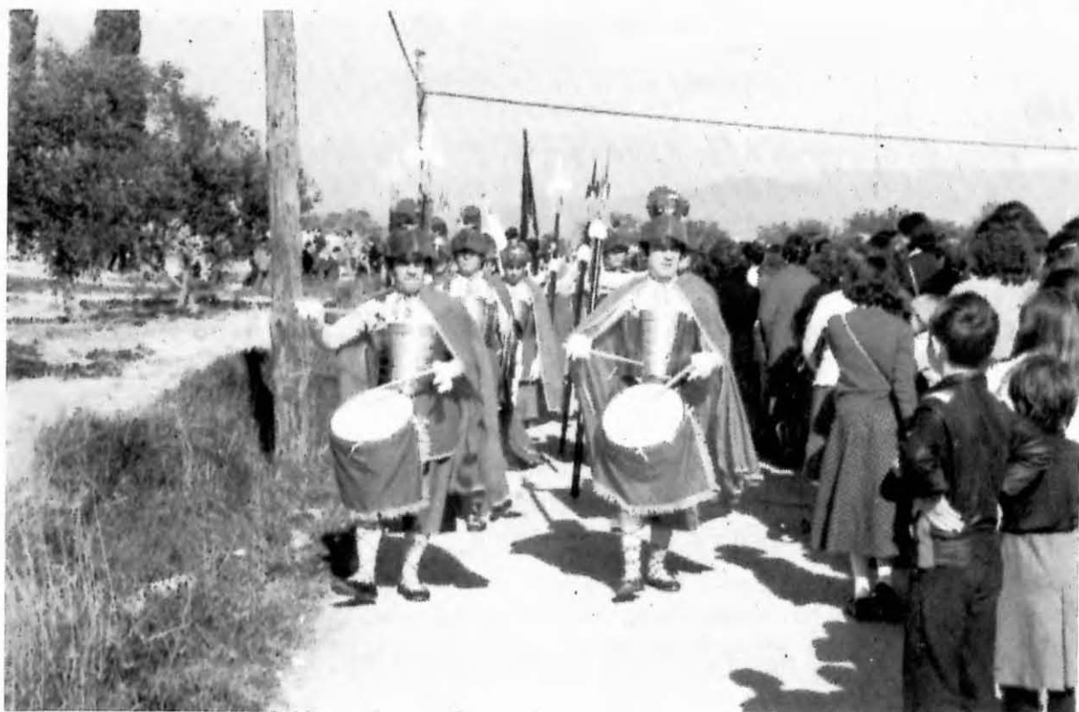
Divendres Sant. "Els Armats"