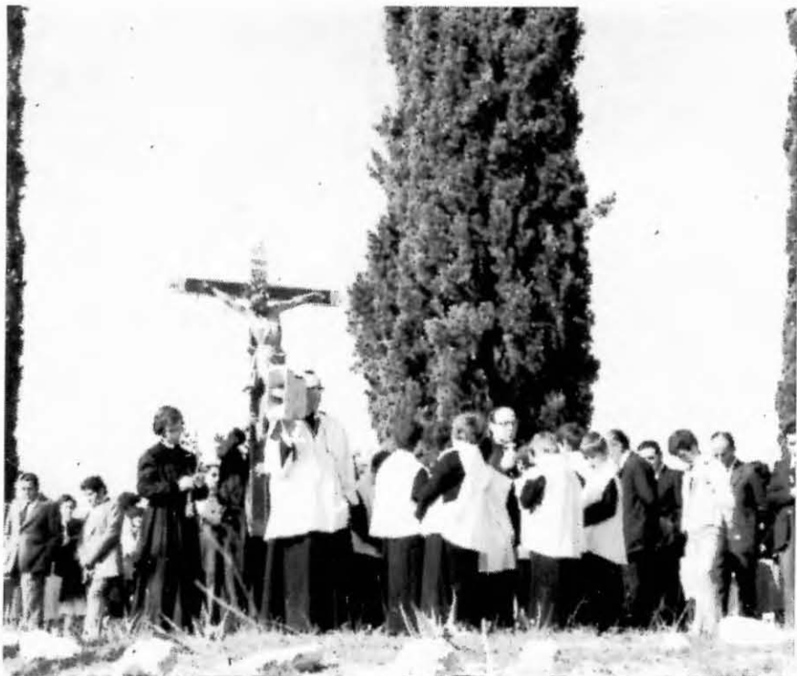
Divendres Sant. Via Crucis

Són dies de cerimònies religioses i tot es desenvolupa en el Temple, menys el divendres Sant, dia en què al matí es fa el Via Crucis al Calvari i a la nit la processó del Sant Enterrament.