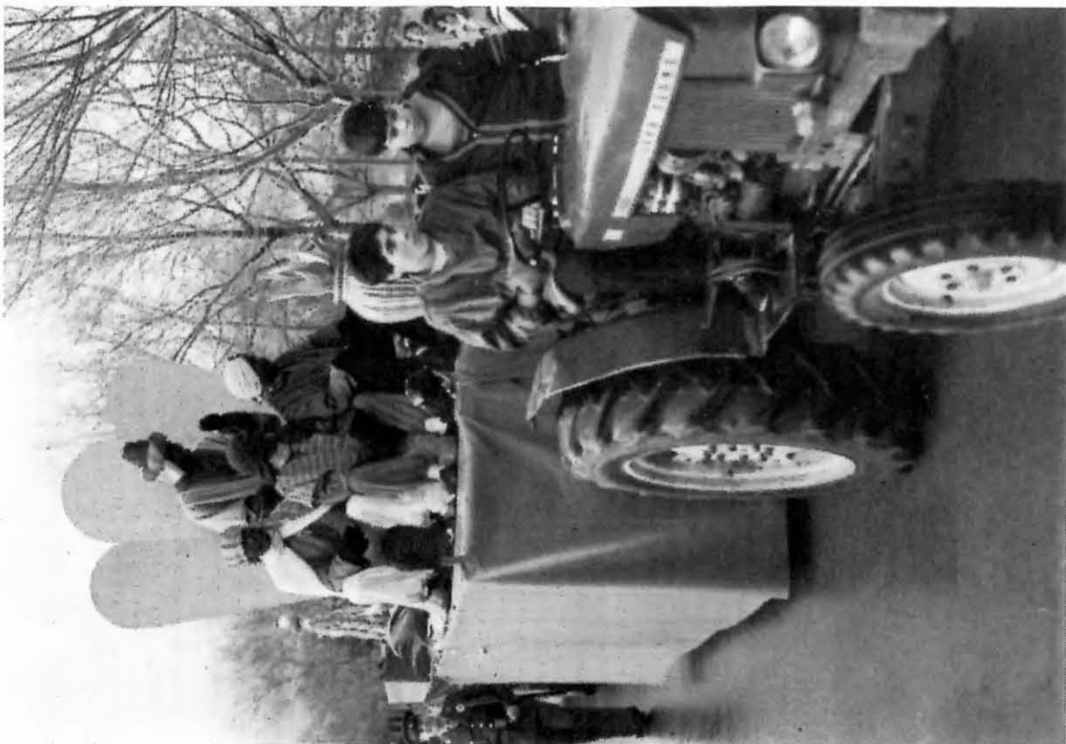
Cavalcada de Reis