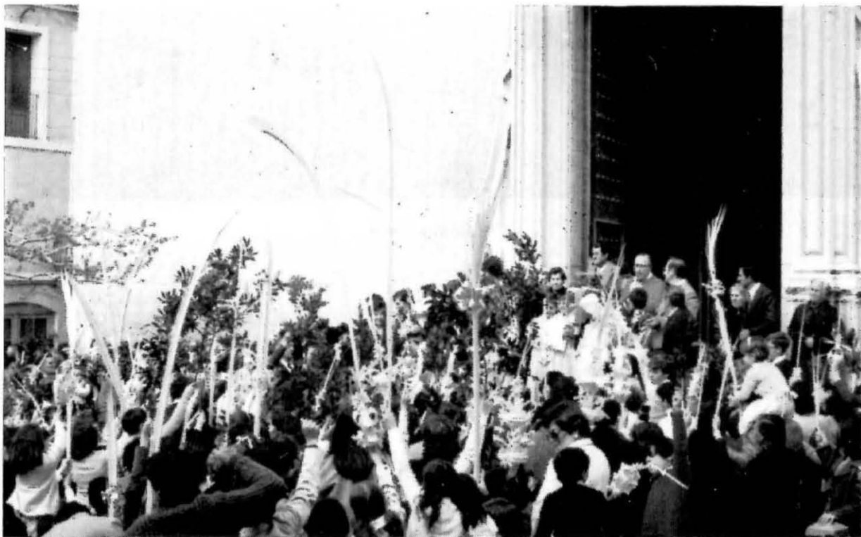
Diumenge de Rams. Benedicció de les palmes

És tal com l'hem descrita més amunt. Cal fer notar el gran augment d'assistents a la processó en els últims anys a causa, en gran part, a l'augment de població que ha experimentat Constantí.