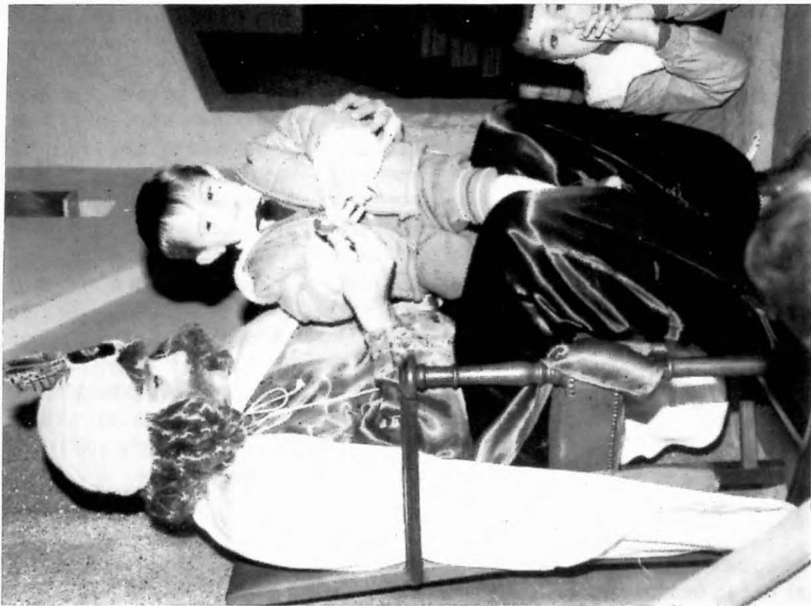
Entrega de cartes al patge