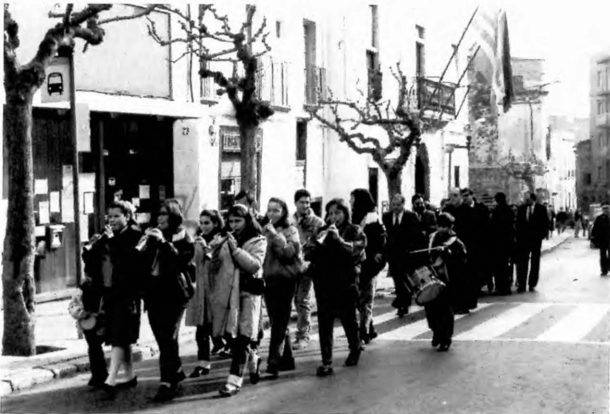
Sant Sebastià. Grallers acompanyant les autoritats a Ofici Major

«Sant Sebastià totes les va arriar (les festes) menys la Candelera que li anava darrera».