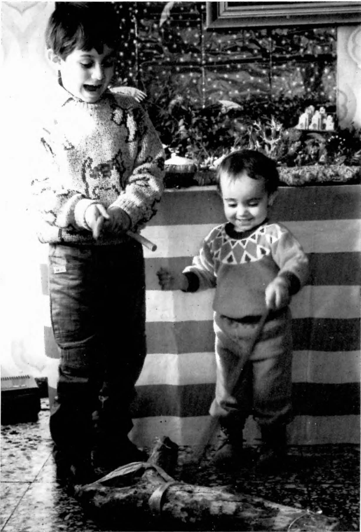
Fer cagar el tió