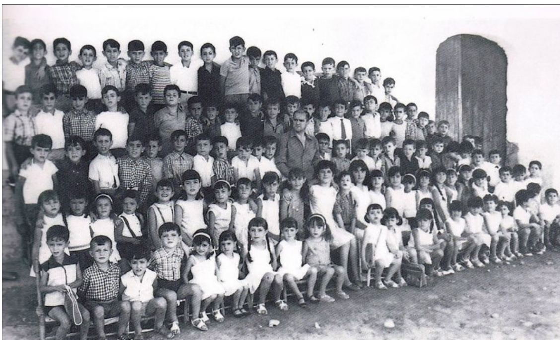
Ilustración 4. Un "maestro de escuela de cagones" con todos sus alumnos. Se observa la edad variada, la mezcla de sexos y el periodo veraniego por el ropaje de los alumnos. Esta foto debe corresponder a mediados de los años sesenta del siglo XX.

persona que las quisiera abrir o implantar. No sabemos cuántas de estas pudieran existir en los años finales del siglo XIX y principios del XX porque las Actas Municipales nunca hacen referencia a este tipo de establecimientos y tan solo, a veces, tenemos noticia de alguna maestra auxiliar que prestara sus servicios en las aulas desdobladas de párvulos de las maestras titulares. Sin embargo esta situación debió existir y perpetuarse porque desde luego hacia mediados del siglo XX sí que tenemos constancia de la existencia de varias de esas que en Villafranca fueron llamadas "escuelas de cagones". Incluso llegaron hasta los años de mi generación. Eran básicamente locales en casas particulares o "corralones" a los que asistíamos sobre todo en periodos vacacionales y donde el objetivo era tenernos "recogidos" en los largos días de asueto hasta la vuelta al colegio a comienzos del curso académico.