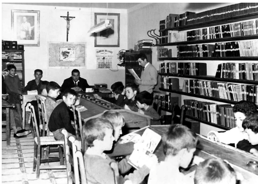
Ilustración 3. Primeras instalaciones oficiales de la Biblioteca Municipal en las traseras del ábside de la parroquia de Nuestra Señora del Valle, frente a la fachada del actual Ayuntamiento.

Las bibliotecas escolares, hasta ahora poco consideradas en la actividad municipal, aparecen en el Acta del 30 de abril de 1940 en la que en su sección de ruegos y preguntas informa el Alcalde que tras reunirse la Junta Local de Primera Enseñanza se estimó ampliar en “algunas pesetas más” la cantidad de 250 asignadas para las bibliotecas escolares con motivo de la Fiesta del Libro.