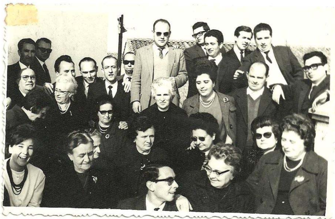
Ilustración 5. Grupo de Maestros y Maestras de épocas más recientes en Villafranca. Década de 1960.

Quizá el hecho de que la mayoría de maestros ya están asentados definitivamente en el pueblo y propietarios de las casas donde viven, hacen creer innecesario el proyecto de construcción. Además se había extinguido la obligación de los ayuntamientos de proporcionar casa-habitación o su equivalente en subvención por la Disposición Adicional 4ª de la Ley de Bases de las Haciendas Locales de 3 de Diciembre de 1953 que exoneraba a las corporaciones locales de costear o subvencionar servicios de la Administración General 46 e igualmente en su Decreto de desarrollo de 18 de Diciembre.