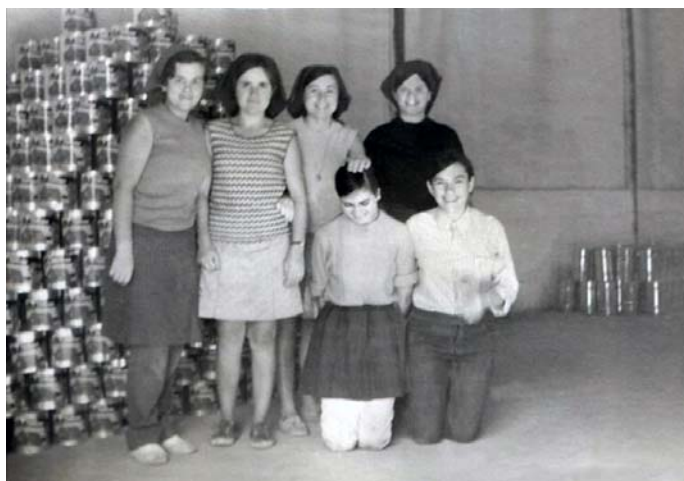
Ilustración 2. Obreras de la fábrica de Conservas Martinete.

Sabemos que paralelamente el Alcalde ha emprendido gestiones ante el Delegado Provincial de Auxilio Social para la creación de una Guardería Infantil por la mucha necesidad de procurar la debida asistencia a los hijos pequeños de las numerosas madres que deben emplearse como sirvientas, operarias de una industria de conservas (fábrica de Conservas Martinete que procesaba conservas de tomate) y otras derivadas de la agricultura. Por ello se acuerda seguir las gestiones, ceder gratuitamente una parcela de terreno de 2000 metros cuadrados en Las Sileras. 24 Más allá se destinan en un presupuesto de subvenciones, una de 50.000 pesetas para la construcción de la futura Guardería infantil pero descubrimos que, incomprensiblemente, debe ser para el proyecto de las Formacionistas pues en la misma acta, más adelante, se decide desistir del proyecto municipal porque sigue en curso el proyecto privado. 25 De ellas serán cargadas en el presupuesto de este año 40.000 pesetas según el Expediente de Subvenciones del Acta 7 de Mayo de 1969. No tenemos más noticias de lo que ocurrió en adelante.