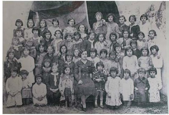
Ilustración 8 20. Grupos de alumnos y de alumnas en escuelas durante la República. Con seguridad se trata de escuelas unitarias dada la diferencia de edades que se observa en cada una de las fotos.