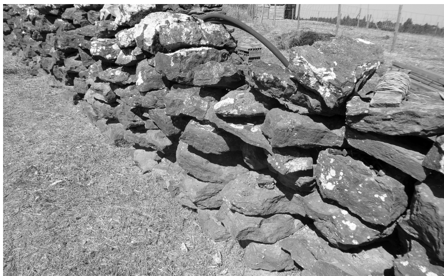
Fig. 3. Muro construído com blocos de minérios ferromanganesíferos, certamente provenientes de jazidas locais. Carrasqueira