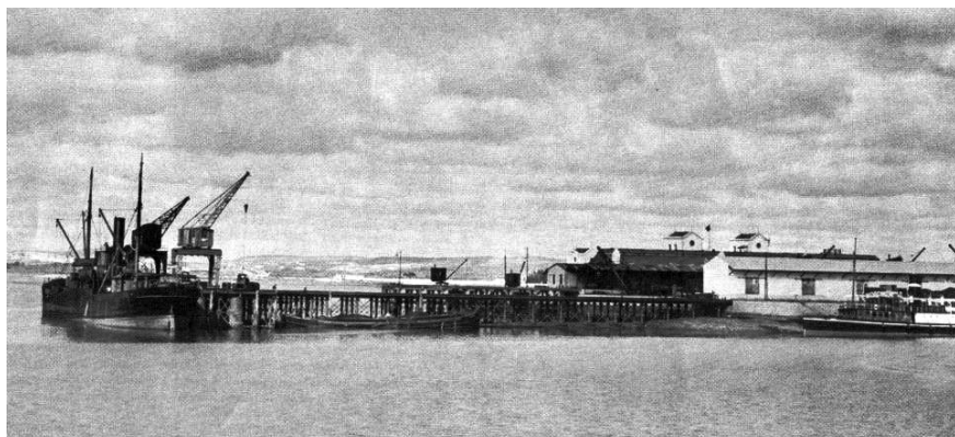
Fig. 1. Construído para escoar a produção da mina dos Monges, o desaparecido terminal mineiraleiro do Barreiro (Ponte dos Ingleses) serviu a outras cargas e descargas. Foi desativado para a realização do aterro em que assentou o terminal rodo-fluvio-ferroviário inaugurado em 1995.