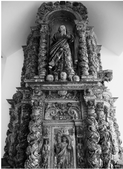
Fig. 6. Sacrário do Retábulo-mor do Convento da Madre de Deus de Sá, Aveiro. 2017, MLNC, ©Arquivo MA.