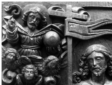
Fig. 19. Representação de São João Baptista, integrada nos painéis de espaldar do cadeirado. 2017, MLNC, ©Arquivo MA.