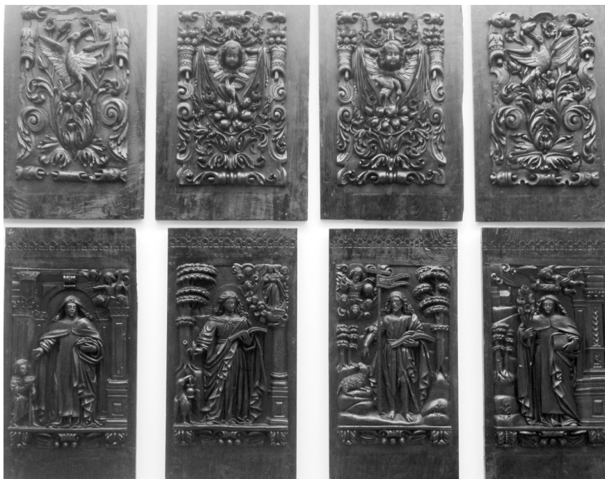
Fig. 16. Espaldar de cadeiral com painéis relevados, entalhados e, originalmente, dourados. 2017, MLNC.

possível de união entre elementos verticais, pilastras de fuste relevado e seção quadrangular intercalando com painéis relevados, figurativos, em alto-relevo, que poderiam ter formado o espaldar do cadeiral do coro alto do Convento de Sá (Figuras 16, 17, 18, 19 e 20).