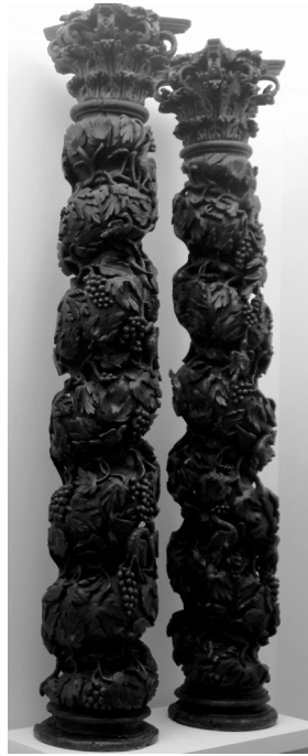
Fig. 5. Colunas torsas com capitéis coríntios do Retábulo da Capela-mor da Capela-mor da Madre de Deus de Sá, Aveiro. 2017, MA / SJ © Arquivo MA.

se colocaram acrescentos de época avançada. As ilhargas cortam em ângulo convexo o tramo central a que nos referimos; o corpo intermédio contém a caixa onde se guardam as hóstias sagradas e o corpo superior integra um nicho (Figuras 6 e 7). Reportando ao contrato de 1688, o sacrário será: