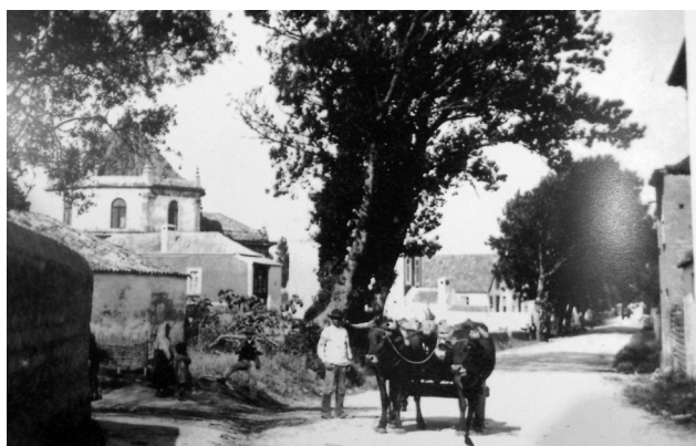
Fig. 3. Rua de Sá, Aveiro, em 1880; imagem de arquivo de António Graça. IMAGOTECA / CMAveiro.