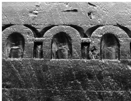
Fig. 20. Detalhe do friso que corre no topo dos painéis onde se denota a aplicação, a posteriori, de vieux-chêne sobre a madeira. 2017, MLNC, ©Arquivo MA.