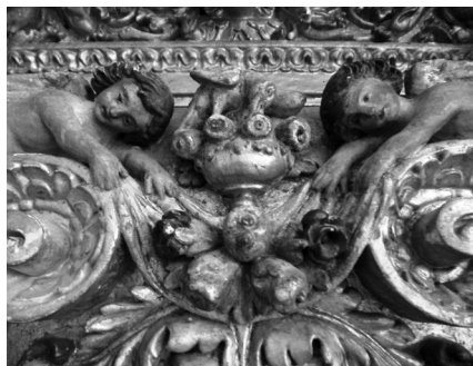
Fig. 10. Anjos e bouquet de flores em arco; composição entalhada, dourada e policromada com aplicação de glasis sobre pigmento carmim. 2017, MLNC.