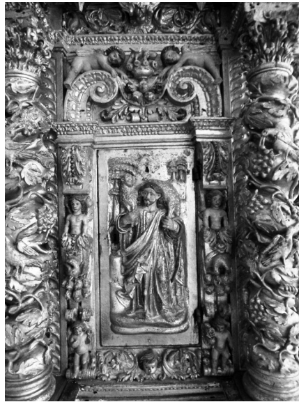
Fig 7. Porta do Sacrário de Sá, integrada no 1º corpo do tramo central. 2017, MLNC, ©Arquivo MA.