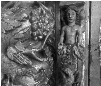
Fig. 8. Detalhe com cariátide figurativa na lateral à porta do Sacrário de Sá. 2017, MLNC, ©Arquivo MA.