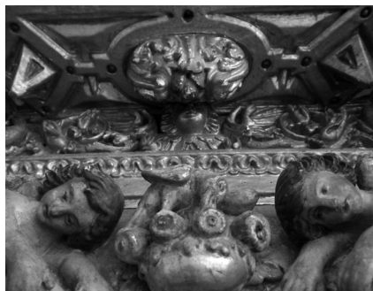
Fig. 11. Destaque de prismas angulares, brilhantes e de cor vermelha - os glasis - que na talha imitam pedras preciosas, tais como rubis. 2017, MLNC, ©Arquivo MA.