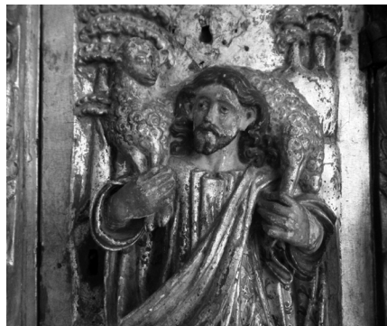
Fig. 9. Representação de Cristo o Bom Pastor, entalhado, dourado, estofado e policromado. 2017, MLNC, ©Arquivo MA.

Estes pequenos “homens angélicos” exibem um colar de contas vermelhas desenhado em redor do pescoço, e os membros inferiores fecham num acanto trilobado com perlado ao centro imitando rubis de cor carmim; a cabeça ampara o enrolamento abalaustrado que emoldura na vertical a porta do sacrário (Figuras 10 e 11).