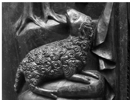
Fig. 18. Representação do Agnus Dei, figuração patente num dos painéis de espaldar do cadeirado. 2017, MLNC, ©Arquivo MA.