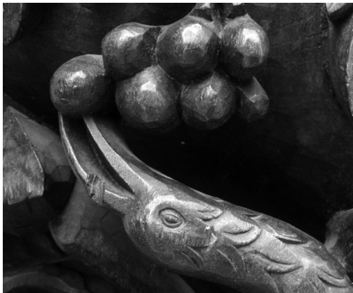
Fig. 15. Ave mítica, a fénix, debicando vagos de uva; elemento entalhado ao qual foi retirada a folha de ouro de origem. 2017, MLNC.

pintor fazer a seleção dos radiantes cromáticos mais adequados aos efeitos que este pretende obter.