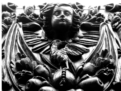
Fig. 17. Entalhe figurativo de painel constitutivo de espaldar do cadeirado. 2017, MLNC, ©Arquivo MA.