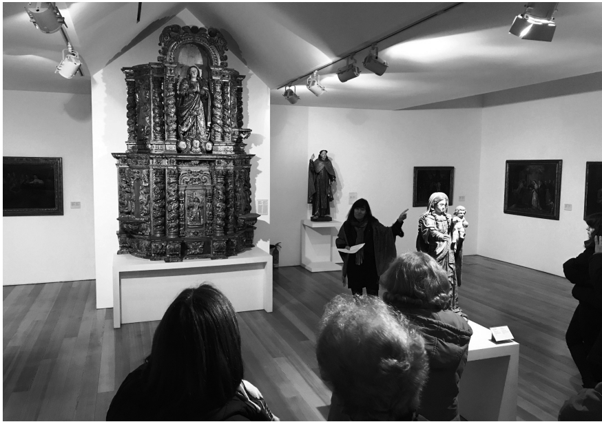
Fig. 14. Museografia da sala 7 onde se integra o conjunto retabular do Convento da Madre de Deus de Sá, de Aveiro. 2017, MLNC, ©Arquivo MA.