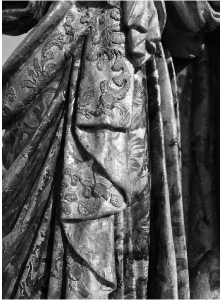
Fig. 12. Detalhe do trabalho de estofa aliado à técnica do meio relevo, imitando brocado da China. 2017, MLNC, ©Arquivo MA.

estofa” como sendo tarefa específica dos douradores que intervêm depois dos douradores e dos encarnadores (Figura 12).