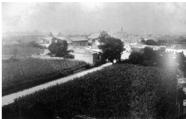
Fig. 2. Lugar de Sá e Barrocas, Aveiro, em 1880; imagem de arquivo de António Graça. IMAGOTECA / CMAveiro.

Acerca da volumetria arquitetónica do espaço Monástico e da envolvente, existem algumas imagens, do passado recente, recuperadas num antigo acervo doado pelo António Campos Graça 5 à imagoteca municipal. São registos fotográficos da época de Oitocentos, com especial destaque para o cliché de 1880, no qual se inscreve uma vista panorâmica a partir da Capela do Senhor das Barrocas abrangente a toda a zona das Agrads, ou mais corretamente, à das Granjas (Figuras 2 e 3).