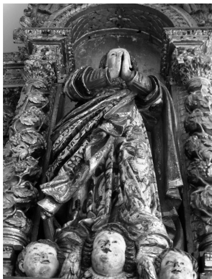
Fig. 13. Escultura de vulto de N. S. da Conceição integrada no nicho central do Sacrário de Sá. 2017, MLNC.

cão por cima destas colunas serão todos dourados e lho (?) se vera de estofado algus sarafins que nelles estão” (Brandão 1984:657). O brocado volta a referir-se na seguinte passagem do contrato: “as Asas dos sarafins e se lhe meterão Algus Rubins aonde melhor couberem como também os levarão em toda a mais obra adonde ella o pedir, o sacrário será todo dourado do dito ouro bornido e sobido e as imagens que estão nelle serão estofadas de brocado com suas pedras pelas ourelas” (Pinho Brandão 1984: 657). (Figuras 14 e 15)