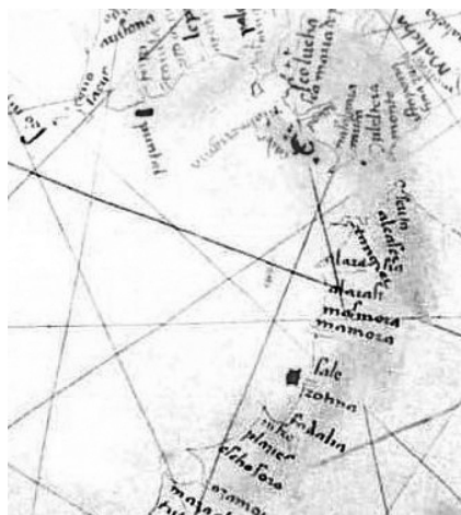
Fig.1. O topónimo Anafé na carta náutica de Zuane Pizzigano, de 1424.

consubstanciado através de intervenções que marcaram a História da Expansão de forma indelével, como a conquista de Ceuta, em 1415, ou a conquista de Arzila, em 1471. No entanto, a experiência de guerra anfíbia desenvolvida no teatro de operações norte-africano não se pode restringir aos grandes feitos de armas immortalizados pelos cronistas régios. É nesse contexto que a análise de empreendimentos menos conhecidos se reveste de particular interesse, na medida em que reflecte a adopção de diferentes considerações estratégicas em função de diferentes objectivos. Numa altura em que passam 550 anos sobre a conquista e destruição de Anafé (Casablanca), considerámos que seria pertinente abordar esta operação anfíbia, analisando de que modo as tácticas, os meios e os efectivos foram estrategicamente utilizados em função das características de que este alvo se revestiu.