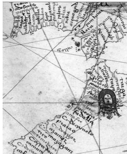
Fig.4. O topónimo Anafé na carta náutica de Jorge Aguiar, de 1492.