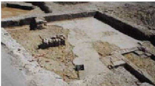
Figura 7. Cisterna solar Torres.

Esta pieza, realizada en mármol blanco, se localizó en el sondeo 1, en el interior de la piscina, en la colmatación de la misma. Sus dimensiones conservadas: 11 x 4 cm. Aunque en origen perteneció a una escultura, un pie desnudo de atleta o divinidad, por las señales de pulido que presenta en su lateral derecho, parece haber tenido un uso secundario como asidero de mano de mortero en forma de dedo con la uña marcada. La reutilización y reciclaje, el expolio o spolia , de elementos marmóreos en el ámbito artesanal fue un recurso muy empleado con el fin de abaratar costes en época bajoimperial, debido a los profundos cambios económicos, sociales e ideológicos acaecidos en estos siglos. .