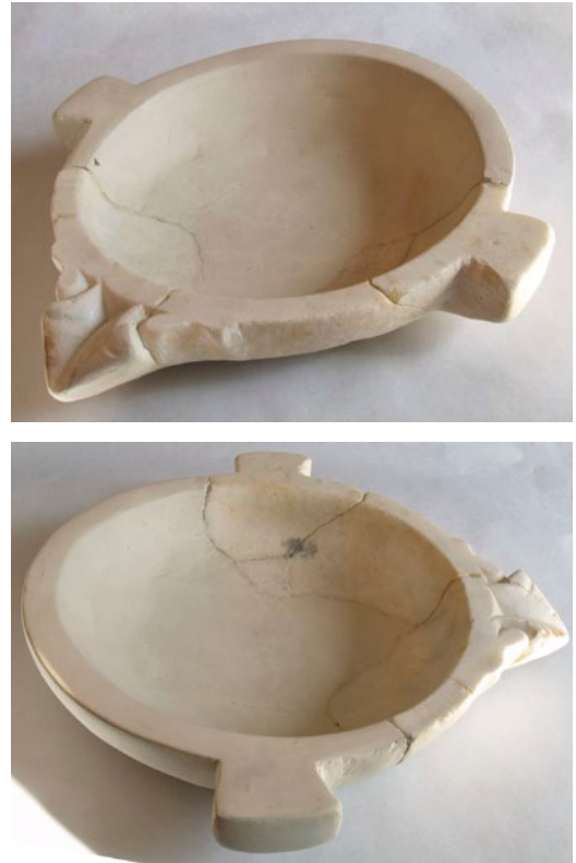
Figura 3 a y 3 b. Mortero de Avenida de la Estación Museo de la Romanización Calahorra.

Desde el punto de vista morfológico, la taza es circular, con el borde plano y cuenta con varias protuberancias rectangulares dispuestas axialmente que tienen la función de asideros o mangos. Como ha sido objeto de una restauración, el número actual de asideros es de dos, aunque la hipótesis más plau-