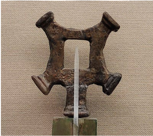
Figura 4. Fiel de balanza de la Avda. de la Estación. Museo de la Romanización Calahorra.