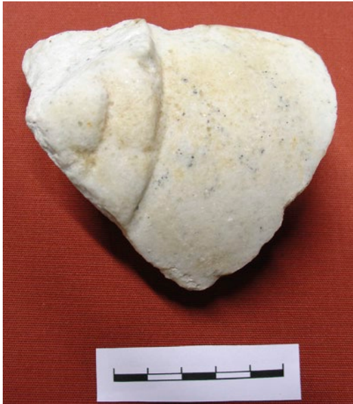
Figura 10 a. Vasija marmórea de la villa romana de la Torreccilla. Cara exterior.

Las dimensiones del fragmento conservado son: 8,5 cm de anchura, 7 cm de altura, su espesor: varía de 2 a 2,3 cm. El diámetro es de 28 cm y la anchura del borde de la taza de 2,2 cm.