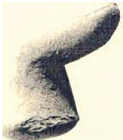
Figura 8 . Mano de mortero en cerámica con forma de dedo, Mulva, Museo Arqueológico de Sevilla (según Sánchez 2005, p. 3).

senia, Kalamata (Grecia). En bronce podemos mencionar el ejemplar de la villar romana de La Agualeja 38 (Monforte del Cid, Alicante) (figura 9).