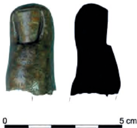
Figura 9. Mano de mortero en bronce con forma de dedo, villa romana de La Agualeja. Museo ibérico de Monforte del Cid, Alicante (según Molina p. 108, fig. 9).