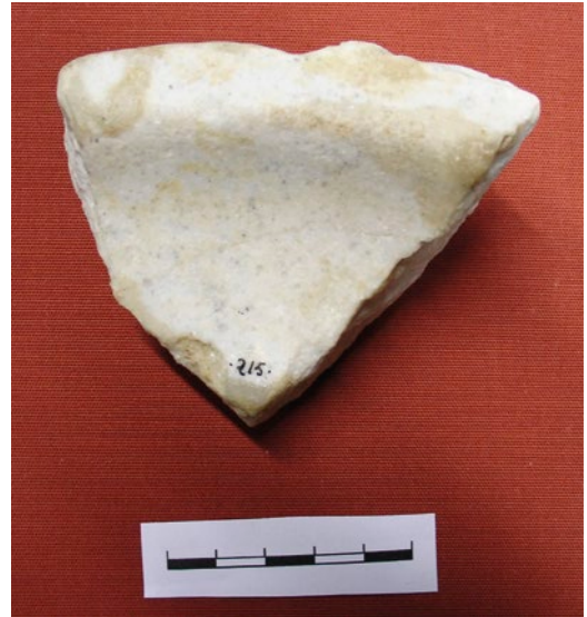
Figura 10 c. Vasija marmórea de villa romana de la Torreccilla. Cara interior.

Se trata de un hallazgo casual, procedente de la colección Gutiérrez Achútegui. Cañada Sauras 44 al estudiar los restos arqueológicos y numismáticos de esta colección hace alusión al mismo como "Trozo de mármol blanco labrado de la Torreccilla. Fragmentos de tubos de plomo para conducir agua. De la Torreccilla. Eran láminas de plomo soldadas con costura".