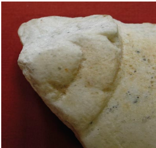
Figura 10 b. Detalle de la decoración.