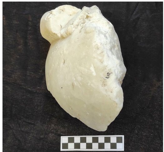
Figura 5. Labrum c/ La Enramada.