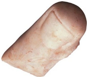
Figura 6. Pistillum solar Torres, Calahorra.

Como dato reseñable la piscina o cisterna presentaba dos fases constructivas, sufriendo remodelaciones en su interior durante el siglo II d.C. La edificación fue retabuada con muros de mejor factura. Consecuencia de ello fue la localización de dos suelos o pavimentos. La cisterna disponía de enlucido y bocel en cuarto de círculo para evitar filtraciones. A partir de la segunda mitad del siglo III d.C. la edificación termal se abandona y la piscina se colmató deliberadamente, localizándose restos de un taller de industria ósea. Entre los distintos materiales del relleno destacan cerámicas como terra sigillata hispánica, lucernas, norteafricana de cocina, monedas y algunos elementos escultóricos, entre los que se encontró el fragmento de pistillum .