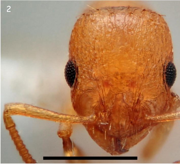
Fig. 2.- Obreira de T. pardoï de Sobredo. Cabeza en vista frontal. Escala: 0,5 mm.