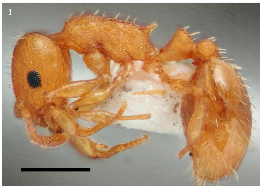
Fig. 1. - Obreira de T. pardo de Sobredo. Habitus, vista lateral. Escala: 0,5 mm.

Táboa I. - Índices biométricos para as tres castas de T. pardo , de diversas localidades de Galicia. Medidas según Seifert (2018). CL: lonxitude cefálica; CW: largura cefálica, a través dos ollos; CS: tamaño cefálico, media de CL e CW; SL: lonxitude do escapio; FRS: amplitude das arestas frontais; EYE: media dos diámetros maior e menor dos ollos; POOC: distancia postocular; SPST: lonxitude das espiñas propodeais, do espiráculo propodeal ata a punta; SPTI: separación entre os extremos das espiñas propodeais; MW: largura máxima do mesosoma; ML: lonxitude do mesosoma; PEH: altura do pecíolo; PEL: lonxitude peciolar; PEW: largura do pecíolo; PPW: largura do pospecíolo; PNHL: lonxitude máxima das quetas do pronoto.