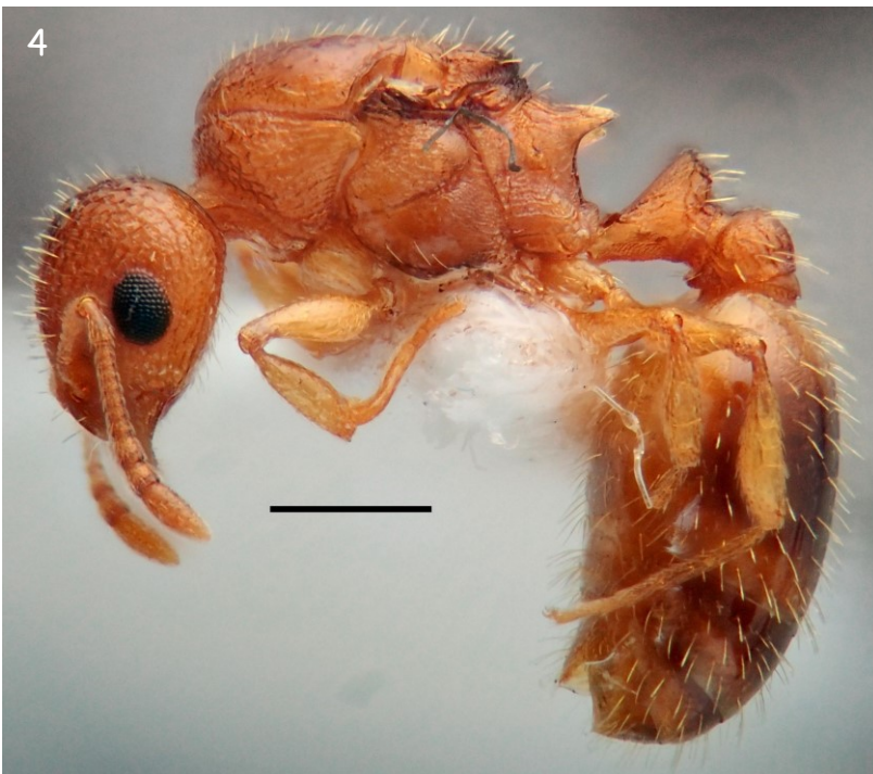
Fig. 4.- Raiña de T. pardoï de Formigueiros. Habitus, vista lateral. Escala: 0,5 mm.