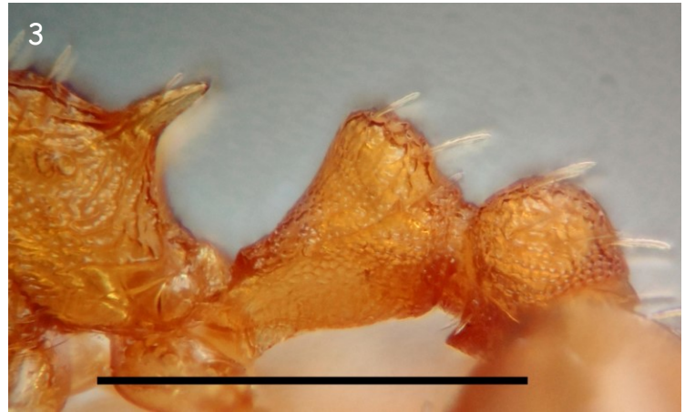
Fig. 3.- Obreira de T. pardoï de Sobredo. Detalle de propodeo, pecíolo e pospecíolo, vista lateral. Escala: 0,5 mm.