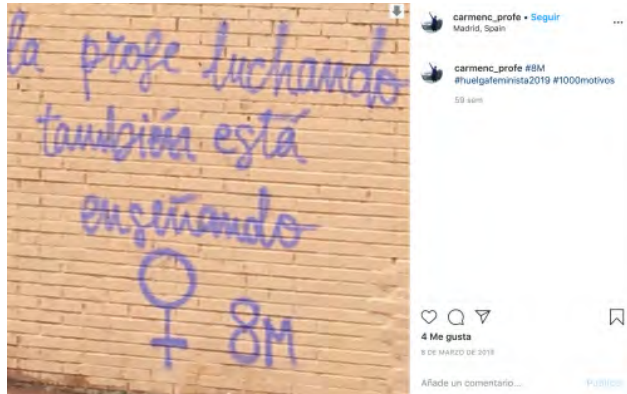
Figura 17.

Las pintadas también son un repertorio de la protesta que, al igual que las pancartas, son objeto de digitalización mediante la fotografía y viven una nueva difusión a través de posts . Al igual que el resto de los elementos, las pintadas son hoy una plataforma más que puede servir de soporte al mensaje y sus mensajes pueden provenir o viajar a cualquier otra plataforma disponible. En este ejemplo, se puede observar cómo la pintada se traslada a las pancartas (Figuras 17 y 18).