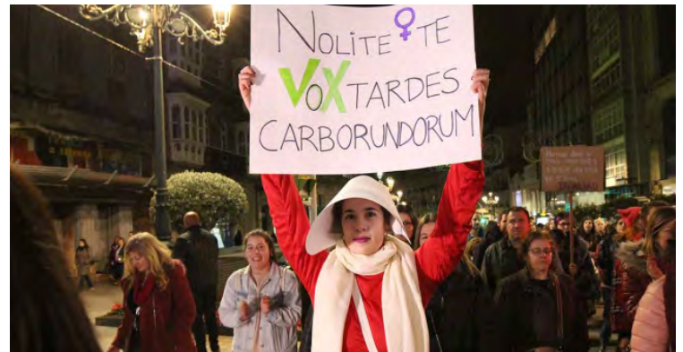
Figura 14.

Esta narrativa se apropia de los referentes de la cultura de masas y los usa para construir un mensaje a través de todas las plataformas disponibles, desarrollando una narrativa transmedia cuyo mensaje se mantiene a través de las diferentes plataformas (Costanza-Chock, 2012). El uso