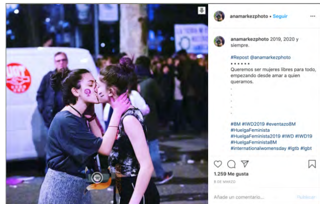
Figura 5.

La importancia de los cuerpos en las movilizaciones feministas es un elemento que se repite. Los cuerpos son elemento de protesta, pero también portadores y mensajes en sí mismos (Sola-Morales, 2013). En las reivindicaciones por la visibilidad y el reconocimiento de la existencia de las realidades queer , mestizas o transgénero, el propio cuerpo se vuelve una reivindicación (Hernández Conde, 2020).