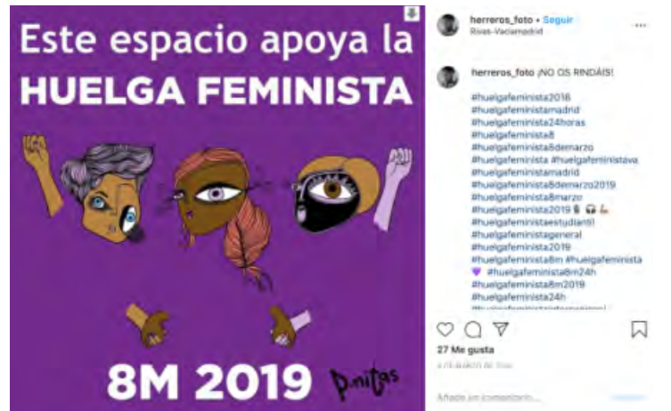
Figura 12. Fuente: Ilustración de @p.nitas, compartida por @herreros_foto