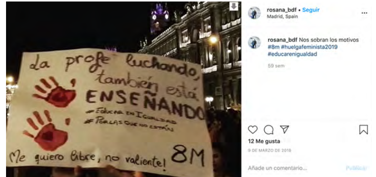
Figura 18.

La inclusión de estas imágenes no supone que hayan sido realizadas por la propia autora, ni siquiera que respondan a ese día en concreto, sino que, a través de su inclusión en el flujo de imágenes, en el “ambiente