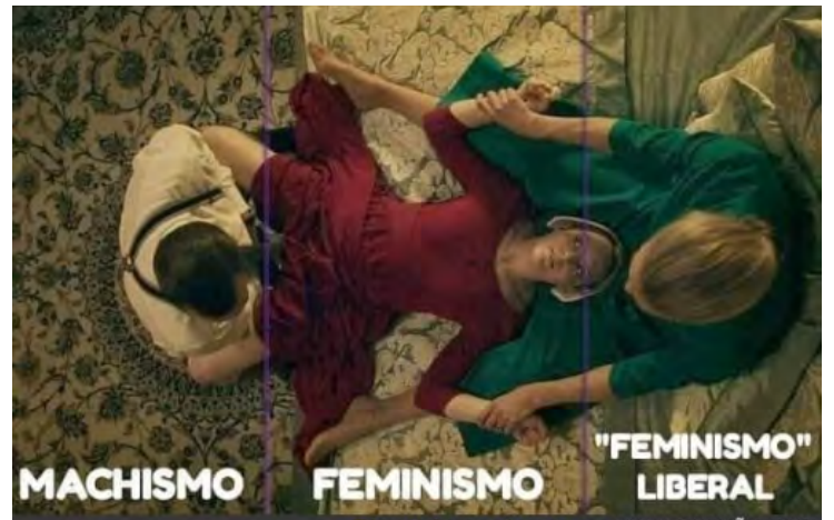
Figura 16.