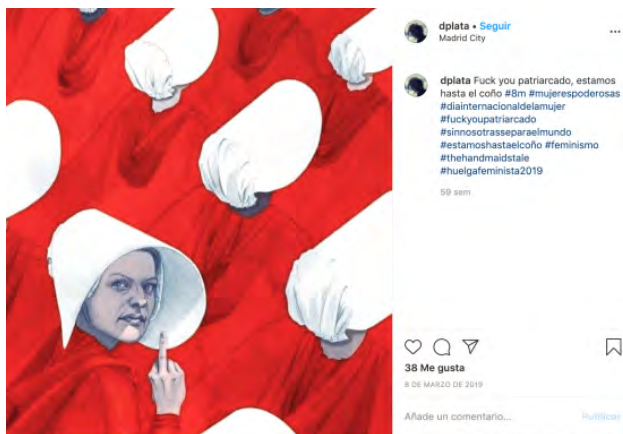
Figura 13.

El siguiente ejemplo (Figura 13) se caracteriza por el uso de referentes de la cultura de masas, otra característica destacable del 8M. Se parte de una ilustración que representa a los personajes de la serie El cuento de la criada , distribuida por HBO en España.