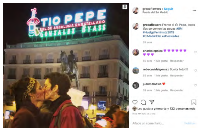
Figura 6.