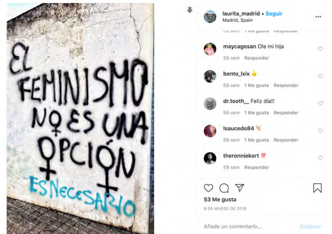
Figura 19.