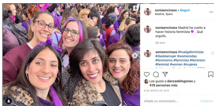
Figura 4.

siempre se retratan en grupo, juntas, identificándose con uno de los ejes del discurso feminista: la sororidad. En este proceso de fotografiarse juntas, como decía Mirzoeff (2016), parecen querer encontrarse a sí mismas como grupo dentro del movimiento feminista y, a la vez, mostrarse a los demás mediante la digitalización y el acto de compartir en redes dicho momento. A este respecto, las mujeres son sujetos doblemente activos: ante el agenciamiento de tomar control sobre su propia representación; al representarse como sujetos que generan acción: se manifiestan, se juntan... No es casual, por tanto, que el escenario que se repite en las fotografías sean las calles en el momento de manifestaciones, en el espacio público y el acto de la manifestación, espacios y acciones, ambos políticos. Pero, además, el acto de compartir las imágenes en redes genera una acción más, como se apuntaba para el caso de Brasil (Nemer y