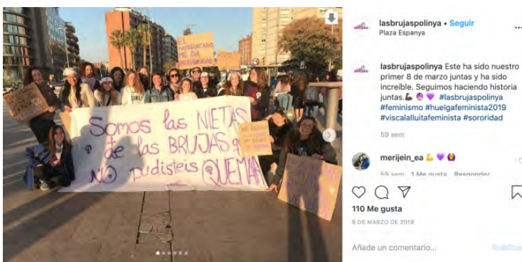
Figura 10.

El hecho de leer al 8M como dispositivo inacabado (Padilla, 2012) y, por tanto, entender que parte del control se ceda a la colectividad, permite que —adhiriéndose a las líneas generales del manifiesto consensuado en el