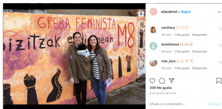
Figura 3.

Estos autorretratos no solo rompen el papel asignado culturalmente a las mujeres. De hecho, no se representan sexualizadas, ni sumisas, ni como víctimas, ni como objetos pasivos a los que mirar. En la mayoría de las imágenes, las mujeres se representan mostrándose fuertes y sonrientes, a veces incluso realizando gestos de empoderamiento como levantar el puño. Uno de los detalles que más destaca de estas fotografías es que