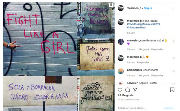
Figura 20.