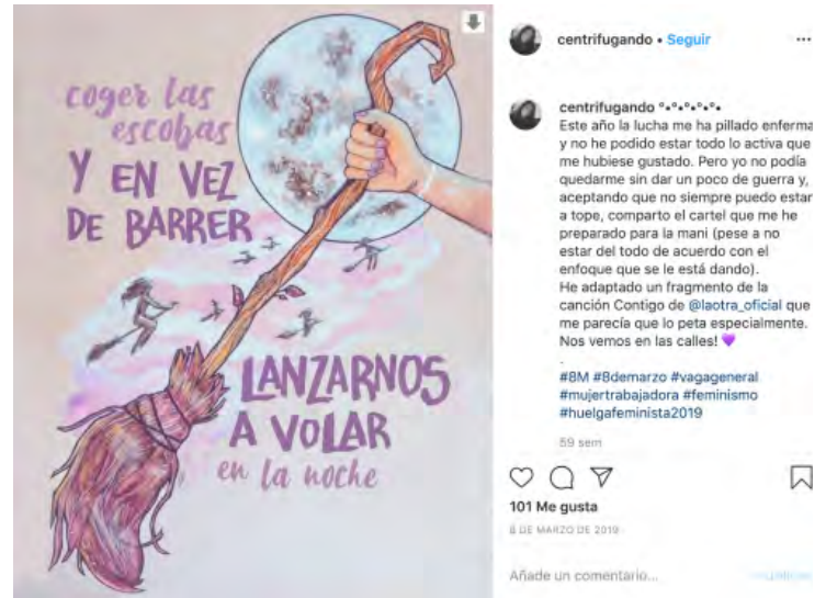
Figura 11. Fuente: Ilustración de @centrifugando