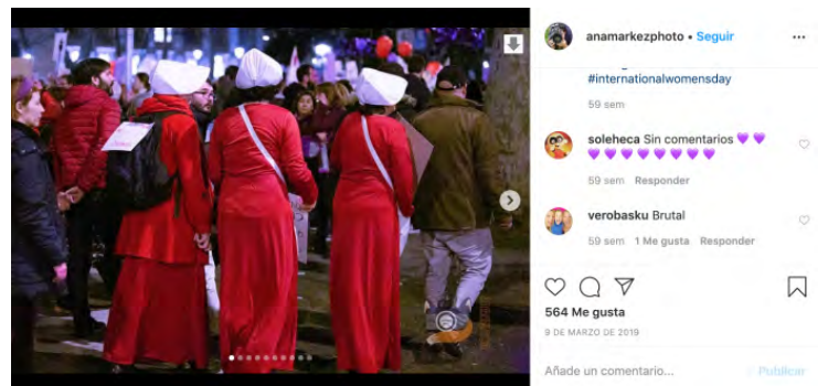
Figura 15.