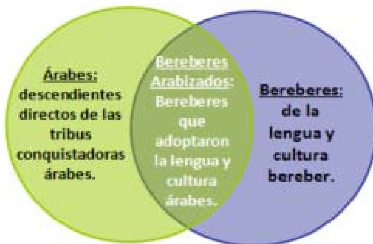
Figura 1. Grupos Culturales

Durante las luchas entre estos pueblos, llevaron a los bereberes del África del norte a las zonas montañosas, permitiendo que los árabes ocuparan las ciudades y llanuras. No obstante, la distinción cultural queda establecida en grupos culturales (Ver figura 1).