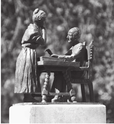
¡Quién supiera escribir! En monumento a Ramón de Campoamor.

haber descubierto ellos. Siempre pasa lo mismo. En los inicios del siglo XX, los poetas ultraístas nos obsequiaron con poemas en forma de cruz, en escalera, en forma de botella. Se creían muy originales, pero no hicieron nada que Carbonero y Sol no nos hubiera transcrito en Esfuerzos del ingenio literario , un libro difícil de conseguir, es cierto, pero que se adelantó a algunos planteamientos del ultraísmo en un cuarto de siglo. Más tarde, en los 60-70, los poetas no repitieron el invento. Así que en poesía, como en todo, poco hay nuevo bajo el sol.