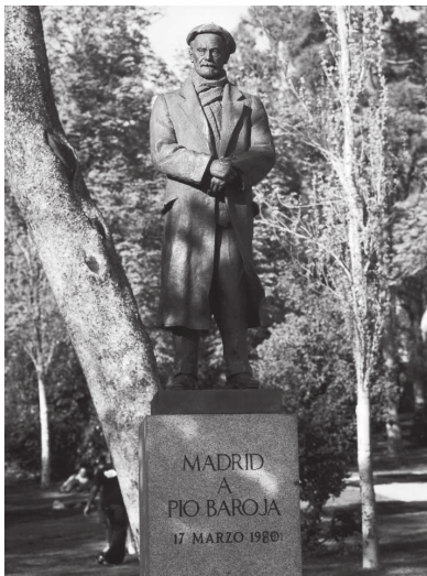
Estatua a Pío Baroja.

Cerca de la Puerta del Ángel Caído, uno de los monumentos más curiosos de El Retiro, de Madrid y del resto del mundo, se alza la estatua de Pío Baroja. Ricardo Bellver realizó en 1878 la estatua en bronce del Enemigo de Dios que es realmente fascinante. Salvo en las gárgolas de las catedrales la iconografía del Diablo es escasísima y sorprende que se le haya erigido un monumento precisamente en España, que nunca quiso muchas cuentas con El Maligno. Buena prueba de ello es la poca literatura al efecto: desde luego don Juan Manuel, Vélez de Guevara, y Fernán Caballero que puso en texto literario algunos cuentos populares y poco más.