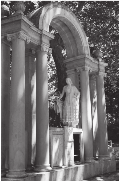
Monumento a los hermanos Álvarez Quintero.

La primera dificultad con la que tropieza una persona que acaba de conocer a los Quintero es saber cuál de ellos es Serafín y cuál Joaquín. Nosotros nos lo hemos hecho explicar muchas veces, y en este momento no nos acordamos ya.