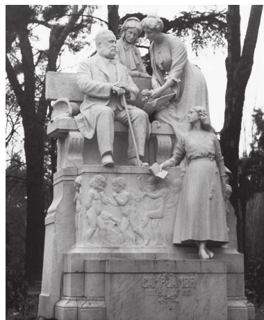
Monumento a Ramón de Campoamor.

Ya hemos señalado la componente literaria de Lorenzo Coullaut-Valera. Otra característica es necesario apuntar, ésta de naturaleza meramente escultórica: la perfecta hibridación entre los diferentes materiales, y en especial del mármol, la más bella sin duda de todas las materias definitivas, con la solidez metálica y el empaque del bronce. Así está concebido el monumento al gran poeta Campoamor, al que Mariano de Cavia, promotor del monumento, denominó «el poeta de la mujer». Si no lo has visto, querido oyente y más tarde lector, corre al Retiro, y en la Avenida de Fernán Núñez lo verás esperándote para que contemples su belleza. Puedes cerrar, si quieres, los ojos y atender mis explicaciones, pero por mucho que me esmere, seguro que no he de conseguir ni de lejos igualar la belleza del monumento. ¡Ay, quién supiera escribir con palabras tan bellas que igualaran a los mármoles de Federico Coullaut-Varela!