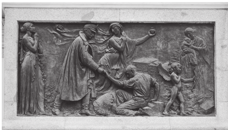
Relieve a la Caridad Real, en monumento a Alfonso XII.