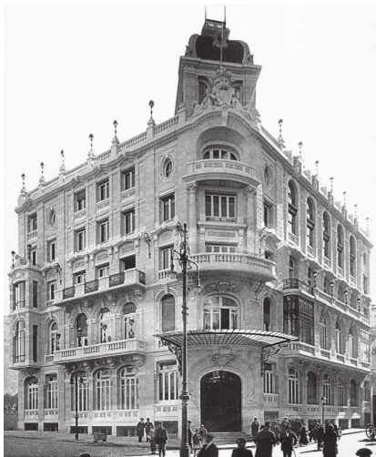
Centro Cultural de los Ejércitos (antes Casino Militar). Edificio inaugurado en 1916.

Ateneo se inaugura el 16 de julio de 1871, en un primer momento ocupa un piso de una casa en la calle Santa Catalina de los Donatos.