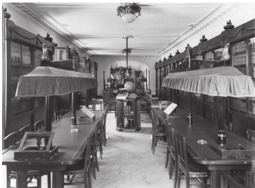
Biblioteca del Círculo de la Unión Mercantil e Industrial.

metálico, al igual que en los dos edificios anteriormente comentados. El Círculo ocupa la mayor parte del sótano, el subsótano, el entresuelo, el principal, el primer piso y la parte de la terraza que da a la Gran Vía y que se dedicará a comedor de verano. Al distribuir las plantas se tuvo especial cuidado de dar la mayor diaphanidad a los salones haciendo que todos estuvieran próximos y con entrada directa desde el patio central, rodeado de galerías que permiten desde cualquier sitio ver los salones de fiestas, de tresillo, de conversación, dando de este modo un carácter de agradable intimidad al conjunto.