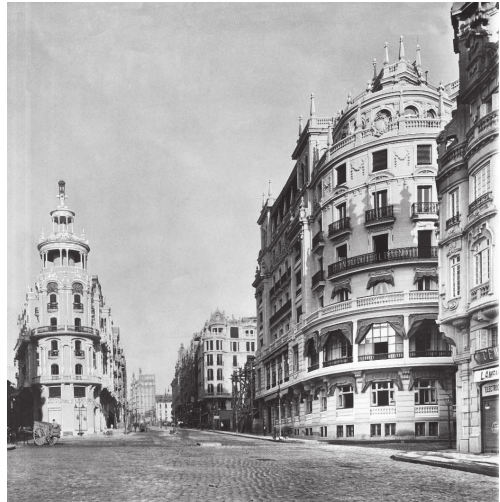
Edificio de la Gran Peña, en el arranque de la Avenida del Conde de Peñalver.

Existe un apremio cada vez mayor por abandonar el contrato de arrendamiento de la finca de la calle Alcalá esquina con Sevilla que, aparte de no tener condiciones suficientes, resultaba muy costoso. En 1912 se decide la compra de un solar en la nueva Gran Vía, pero el alargamiento de las negociaciones con la empresa concesionaria de la urbanización hace que la compra no se materialice hasta principios de 1914. El solar mide mil ochenta y nueve metros cuadrados y ha costado, incluyendo los gastos de escritura, ochocientos cuarenta mil pesetas, satisfechas al contado. 16