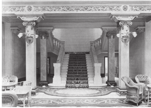
Entrada al Edificio de la Gran Peña e Industrial.

Toda vez que estimamos de capital importancia el atractivo de poder disfrutar los socios de las vistas y animación de la vía pública... Relegando al uso de tiendas las crujía del fondo, que da a la calle de la Reina. 17