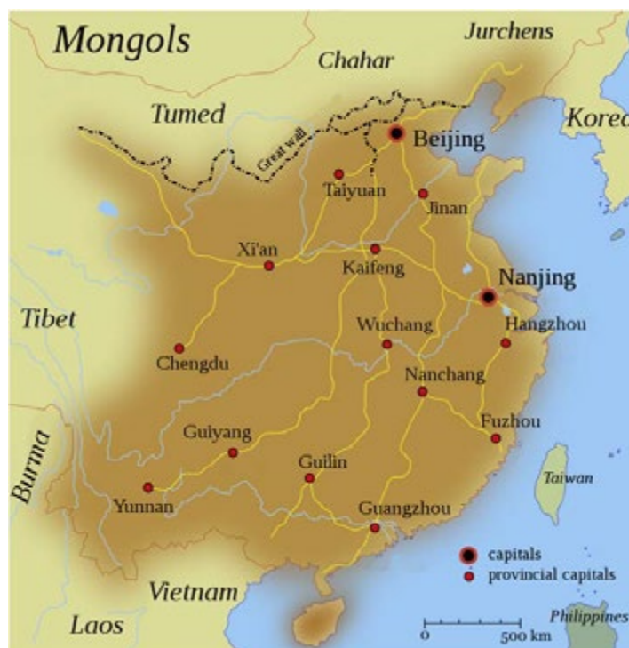
Figura 2. Mapa del Imperio Ming hacia 1580.

No puede concebirse la implacable persecución desplegada por las autoridades chinas contra determinadas confesiones religiosas sin explicar antes dos conceptos: chinización y xie jiao . El término chinización hunde sus raíces en la Edad Media y comienza a utilizarse ampliamente a partir del siglo XVII. Hacía referencia a las políticas introducidas por el Imperio chino para persuadir, e incluso imponer por la fuerza si era necesario, a las minorías étnicas y lingüísticas diferentes a la predominante etnia han, tales como los miao o los uigures, para que terminaran adoptando la cultura, el idioma y las costumbres chinas.