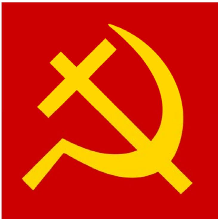
Figura 1. Wilfredor, Public domain, via Wikimedia Commons. Fuente. Disponible en: https://es.wikipedia.org/wiki/Comunismo_cristiano#/media/Archivo:Christian_communism_logo.svg

El Partido Comunista de China (PCCh) defiende oficialmente el ateísmo, pero reconoce al mismo tiempo y tolera la práctica de cinco religiones: budismo, catolicismo, taoísmo, islam y protestantismo. Bien es cierto que las autoridades monitorean muy de cerca tanto a aquellos grupos religiosos oficialmente registrados como a los grupos no registrados. Es indudable que tanto la práctica de religiones como su número de seguidores en China no cesa de aumentar 1 . Algunos expertos señalan que el detonante de esta situación puede ser, en el marco de un proceso de rápido despegue económico y modernización en que se encuentra inmersa China, la aparición de un «vacío espiritual», lo que explicaría el importante crecimiento en el número de creyentes; en particular de seguidores del cristianismo y de las religiones tradicionales chinas.