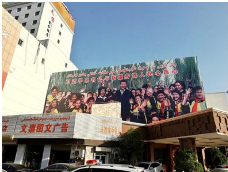
Figura 4. Cartel de Xi Jinping, en el centro de la ciudad de Kasgar (Sinkiang). Leyenda en chino y uigur: «El corazón de Xi Jinping está conectado con los de las personas de todas las nacionalidades de Sinkiang».