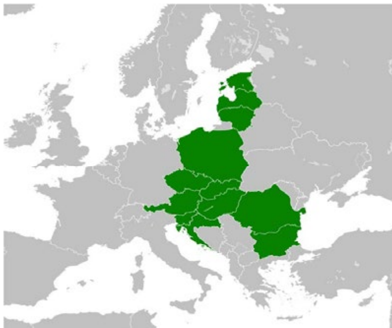
Figura 1. La Iniciativa de los Tres Mares en el contexto europeo.

fracasó debido a las malas relaciones de Polonia con sus países vecinos como Lituania y Checoslovaquia, así como por la falta de apoyo de una verdadera potencia extranjera 4 .