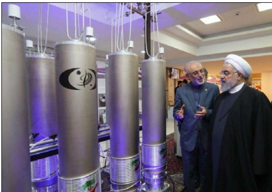
Figura 1. El presidente iraní, Hassan Rohani y el presidente de la Agencia Iraní de Energía Atómica, Ali Akbar Salehi, junto a centrifugadoras de uranio.

A finales de año, los iraníes ya se encontraban enriqueciendo uranio con centrifugadoras avanzadas, no incluidas entre las permitidas en el PAIC. Los países europeos del Grupo P5+1 intentaron evitarlo emitiendo un serio comunicado de advertencia a los iraníes, por el que podrían poner en funcionamiento el «mecanismo de disputas» del acuerdo, por el que se pueden aplicar de nuevo las sanciones si algún miembro permanente del Consejo de Seguridad de las Naciones Unidas no considera que estas deban ser levantadas 11 .