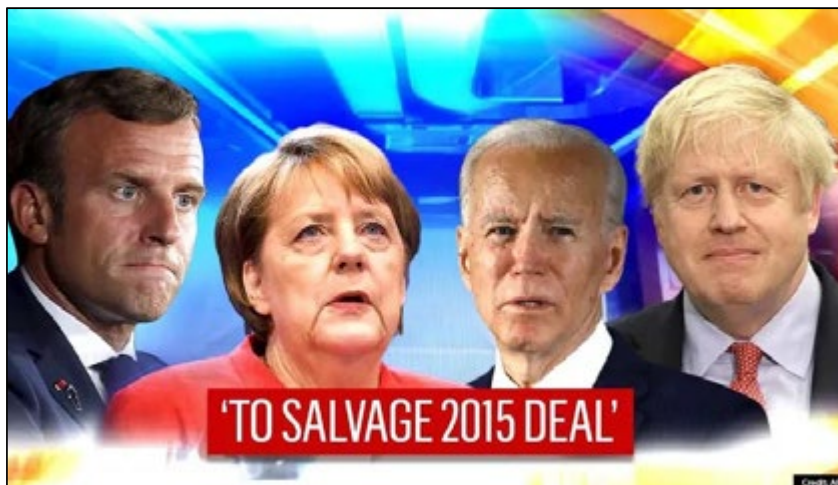
Figura 2. Imagen de los líderes europeos junto al presidente Biden para salvar el acuerdo nuclear.

La nueva orientación estadounidense constituye una gran incertidumbre para Israel, donde se considera que no tiene sentido intentar volver a un acuerdo que ha fallado con la falsa esperanza de un resultado mejor. Para Netanyahu, la única solución es el mantenimiento de una política de intransigencia hacia las armas nucleares, además de compartir con los Estados del Golfo la necesidad del mantenimiento de las sanciones contra los iraníes. Sin embargo, las agendas israelitas y de los países del Golfo no son exactamente iguales. Por su parte, Arabia Saudí atraviesa tiempos convulsos que han debilitado su estatus y teme a una situación de conflicto abierto 35 .