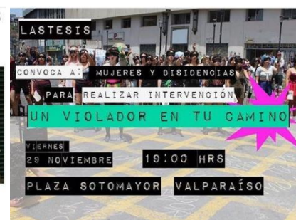
Ejemplo 6: Un violador en tu camino

En el Ejemplo 1 se establece una POLARIZACIÓN entre los rotos desclasados (pertenecientes a la clase baja y media) y los cuicos zorreros (pertenecientes a la clase alta), a quienes se les pretende educar para que aprendan a compartir sus privilegios. En este caso, el esquema ideológico se complementa con la IDENTIFICACIÓN que da cuenta, por una parte, de un colectivo con conciencia de clase (endogrupo) que lucha por terminar con los abusos de poder que ostenta la clase acomodada y, por otra, de una elite (exogrupo) que es indiferente a la desigualdad social y disfruta de sus privilegios mientras el resto del país se encuentra movilizado. Los INTERESES consisten tanto en evidenciar la mantención de dichos privilegios como en visibilizar la necesidad de acabar con ellos, lo cual se consigue a través de la ACTIVIDAD que corresponde a marchar hacia el Portal La Dehesa -el principal centro comercial de una de las comunas más ricas de la Región Metropolitana-, disruptiendo con ello la normalidad a la que sus vecinos están acostumbrados. Acometer este tipo de protesta implica NORMAS Y VALORES que inspiran la acción de educar, asociados a la responsabilidad (de quien educa) y a la empatía y la solidaridad (de quienes buscan ser educados).