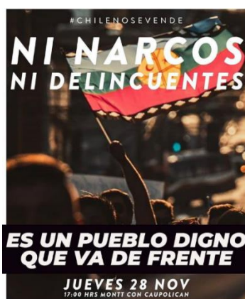
Ejemplo 10: De frente