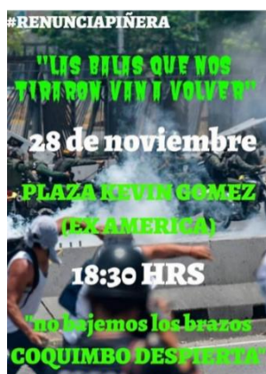
Ejemplo 11: Los brazos