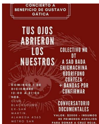
Ejemplo 7: Tus ojos

Las publicaciones seleccionadas para ilustrar este análisis se muestran a continuación: