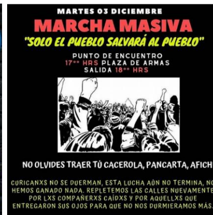
Ejemplo 3: El pueblo