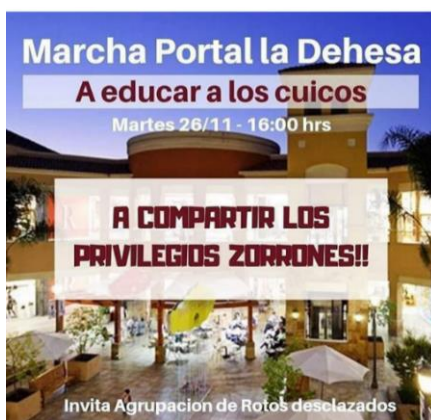
Ejemplo 1: Rotos desclasados

Las publicaciones seleccionadas para ilustrar este análisis se muestran a continuación: