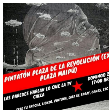
Ejemplo 9: Pintatón