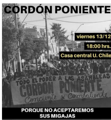
Ejemplo 8: Migajas