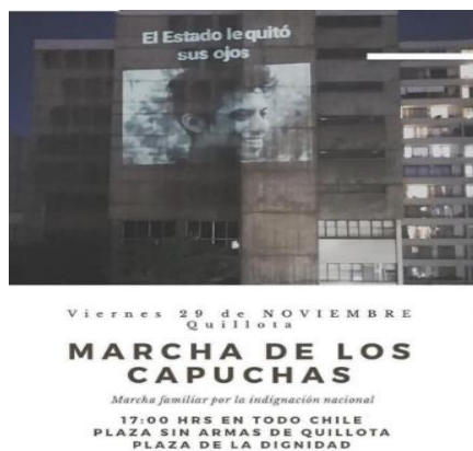
Ejemplo 4: Capuchas 1