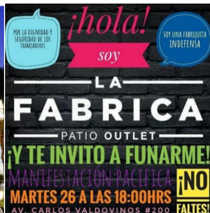
Ejemplo 2: La Fábrica