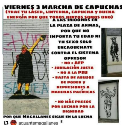
Ejemplo 5: Capuchas 2