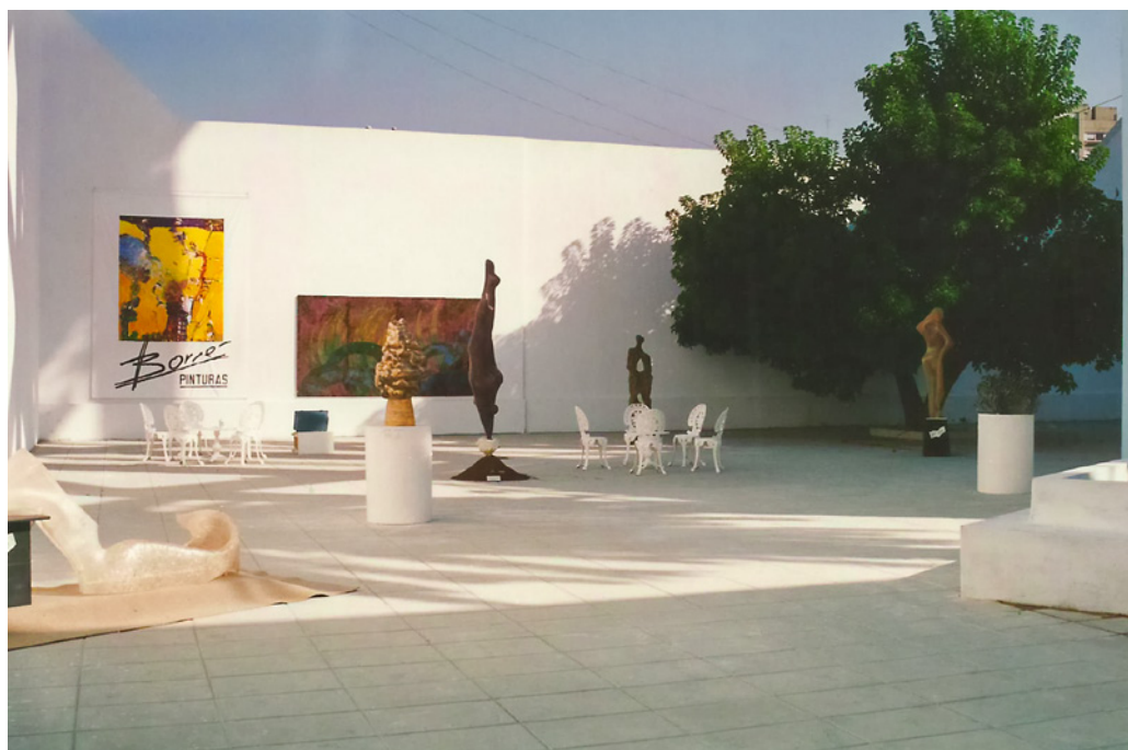
Figura 3. Patio de esculturas en arteBA 1995. Curaduría de Nelly Perazzo.

En 2016 se presentó la exposición "Oasis", cuyo objetivo era ofrecer como parte de los festejos del vigésimo quinto aniversario de arteBA, un panorama del arte contemporáneo desde los noventa en adelante, con la condición de que las obras debían provenir de artistas cuyas galerías participaran en 2016 de la feria. Los curadores se preguntaban si el arte contemporáneo