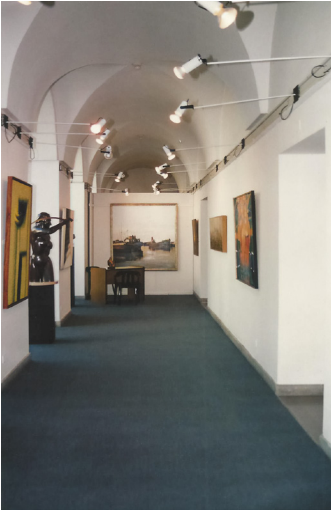
Figura 2. Vista interior del stand de galería Soudan en arteBA 1994.

autor, en una multiplicidad de temporalidades que son condición del hacer histórico, y son propias del encuentro con las imágenes, pues en ellas el presente está en continua reconfiguración. Afirma que solamente existe historia de los síntomas, y que esta apertura permite la inclusión de cierta complejidad que hace visibles zonas heterogéneas de la historia, que permite una visión dialéctica y contingente, recursiva. También Giorgio Agamben (2008) se refiere a lo contemporáneo, aunque en un sentido más general y con una visión nostálgica “... esa relación singular con el propio tiempo, que se adhiere a él pero, a la vez, toma distancia de éste; más específicamente, ella es esa relación con el tiempo que se adhiere a él a través de un desfase y un anacronismo” (Agamben, 2008, p. 1)