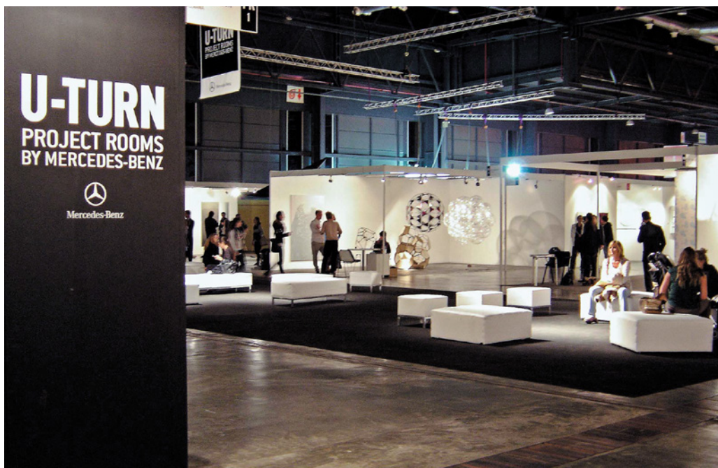
Figura 8. Vista de sección U-Turn en arteBA 2011. "Space elevator/Spark 460" (Tomás Saraceno, 2010) en la galería Andersen's Contemporary.

evidencian una actitud, un modo de colocarse ante el medio y el mercado" (Lebenglik 2003, s/p).