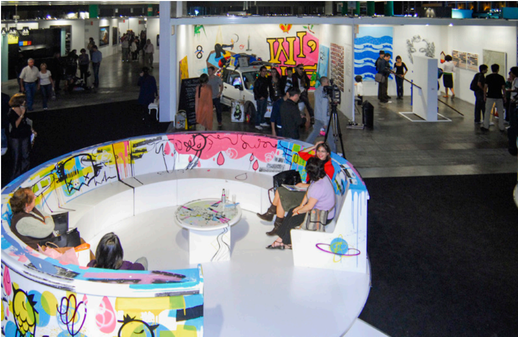
Figura 7. Vista de sección Barrio Joven en arteBA 2009. De izquierda a derecha: galerías Corazón de Bully, Espacio La Punta y Traffix.

Al año siguiente, esta muestra se transformó en una sección de galerías denominada “Nuevas expresiones del arte” y presentó a MOTP Arte Contemporáneo, Sonoridad Amarilla, Van Riel (que instaló un espacio en la sección principal también), Lelé de Troya, Ruth Benzacar (al igual que Van Riel, presente en ambas secciones), Elsi del Río, Instantes Gráficos, Consorcio de Arte de Buenos Aires, Espacio Vox y Belleza y Felicidad. 7 El reconocimiento de la centralidad de estas galerías autogestionadas en un contexto de crisis profunda en el cual se desintegraban los lazos sociales y, también, se desfinanciaba por completo a las instituciones artísticas oficiales, hace explícito un cambio en la escena local y en las maneras de circulación del arte.