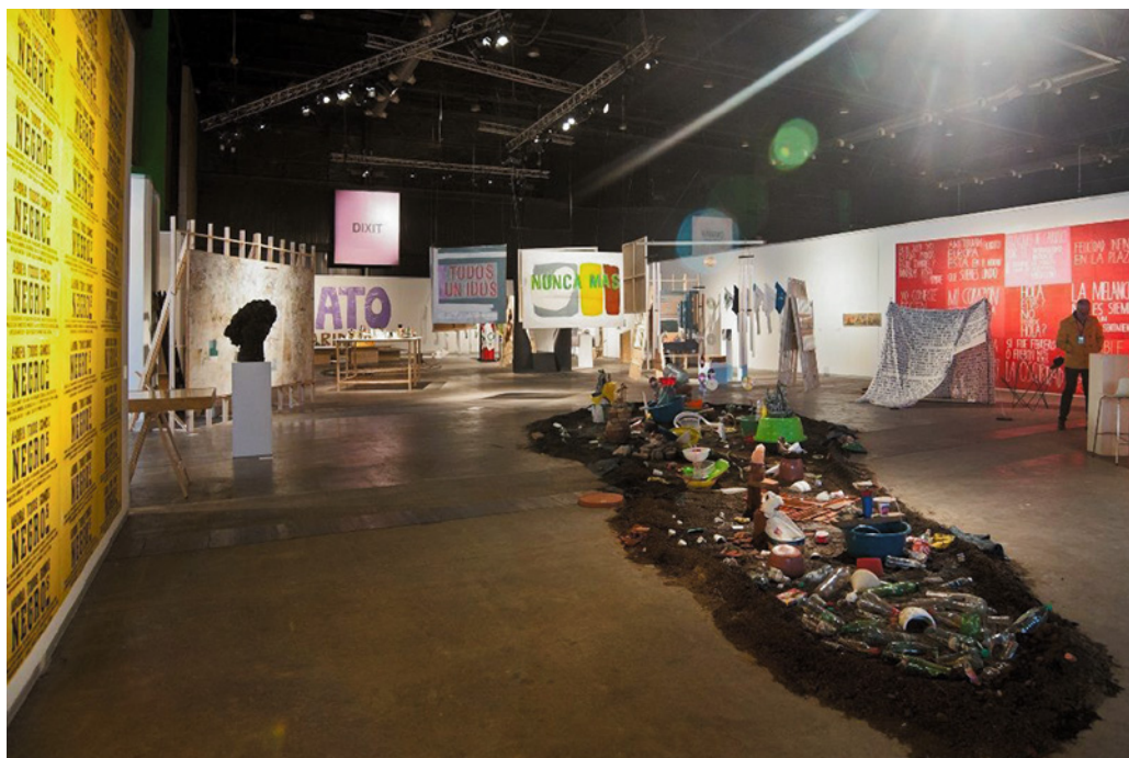
Figura 10. Vista de sección Dixit en arteBA 2016. Exhibición "Oasis", curaduría de Federico Baeza, Lara Marmor y Sebastián Vidal Mackinson. Edición 25 aniversario arteBA.

El modelo de arteBA se configura a partir de uno hegemónico en tanto da cuenta de los elementos y tácticas que componen los circuitos globales y, al mismo tiempo,