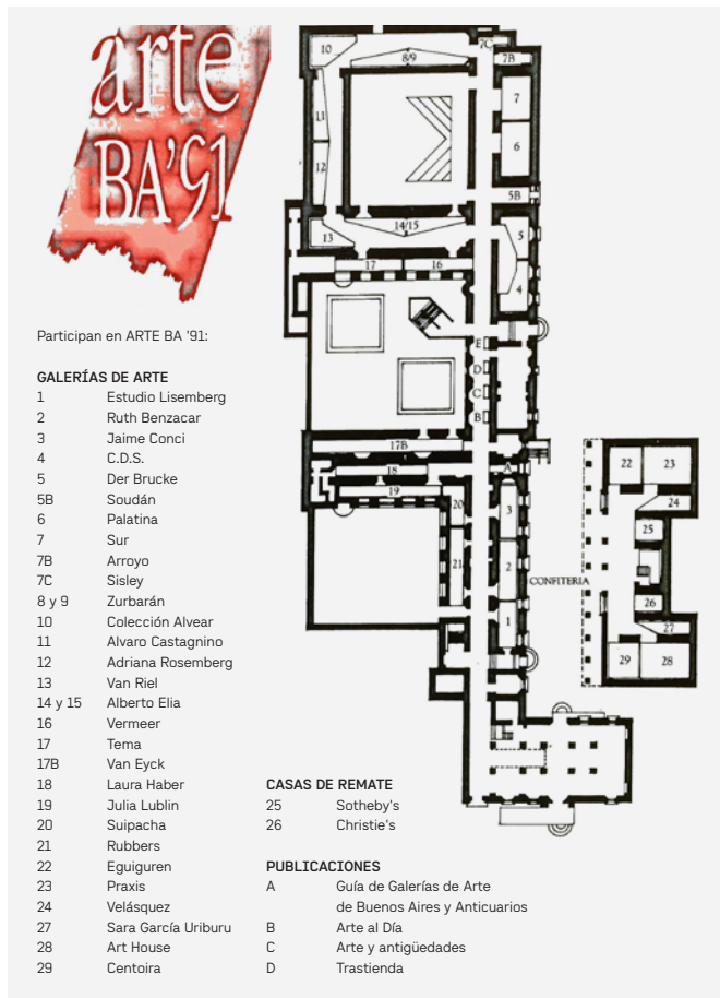
Figura 1. Planta arteBA 1991.

arteBA debía, primero, demostrar calidad (en cuanto a su visualidad, pero también respecto a su sostén académico) y segundo, incorporar artistas con gran circulación por otros espacios. En este sentido, este trabajo propone que tanto lo primero como lo segundo permitieron a arteBA, en especial luego de su transformación como “feria de arte contemporáneo” en 2003, construir su imagen de contemporaneidad.