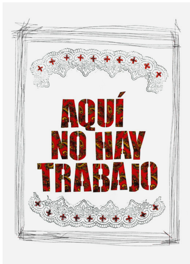
Figura 6. Las Tres Américas . Álvaro Villalobos. UAEM-México, Gustavo Sanabria. UDFJC Colombia. France Joyal, UQTR Canadá 2014. Fotografía, sala ASAB

Al momento de exhibir y socializar el proyecto en cada país, éste tomó diversas configuraciones en sus montajes museográficos, de acuerdo al concepto estético de las agrupaciones artísticas, a las fusiones culturales y a los criterios curatoriales; apuestas museográficas arriesgadas e innovadoras o más esquemáticas y convencionales. Así, la intervención creativa colectiva presentaba perspectivas propias de las instituciones que intervinieron en su construcción, y de igual manera, las diversas posturas ideológicas se hicieron visibles en