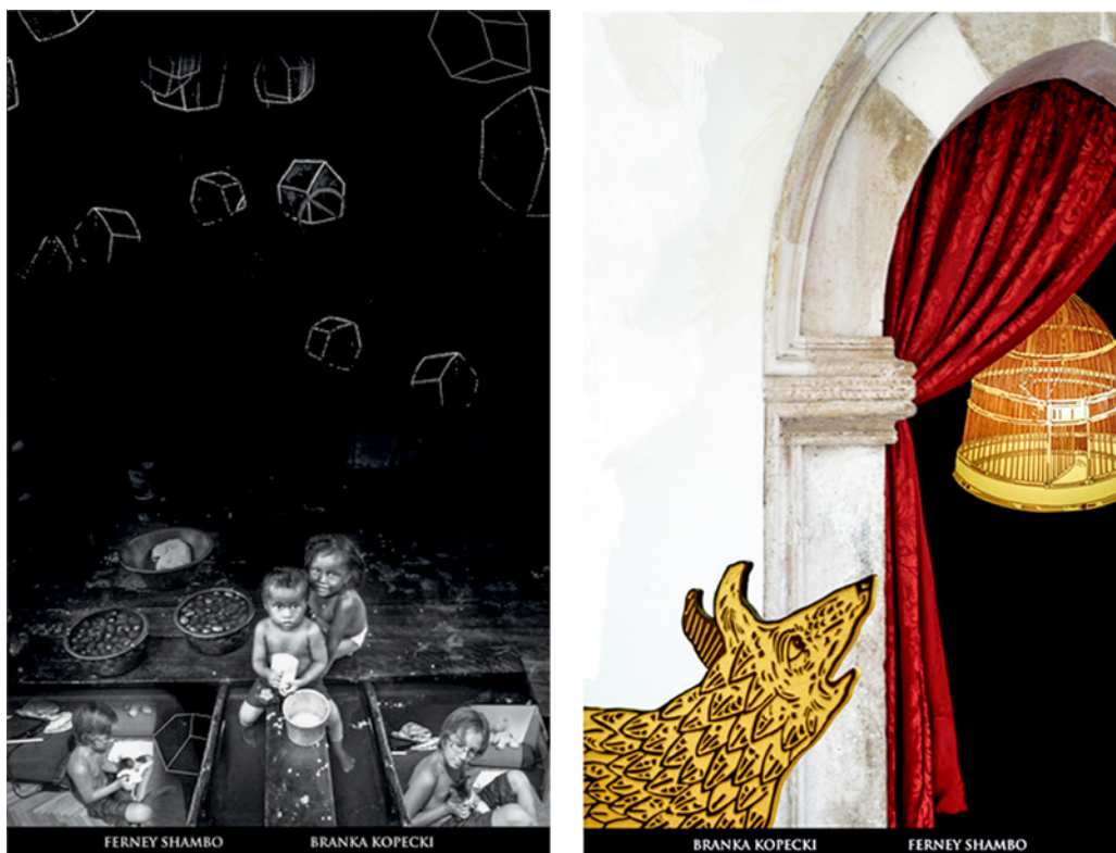
Figura 4. Imágenes y mestizajes culturales (2012) Imagen viajera, elaborada vía WEB. Branka Kopecki, UQTR Canadá. Ferney Shambo, UDFJC Colombia

con objetivos puntuales; muestras de obra gráfica —fruto de los talleres de grabado de APV— que viajaban para ser exhibidas en espacios y salas universitarias como testimonio —a través de la imagen— de situaciones sociales, culturales y políticas de una comunidad.