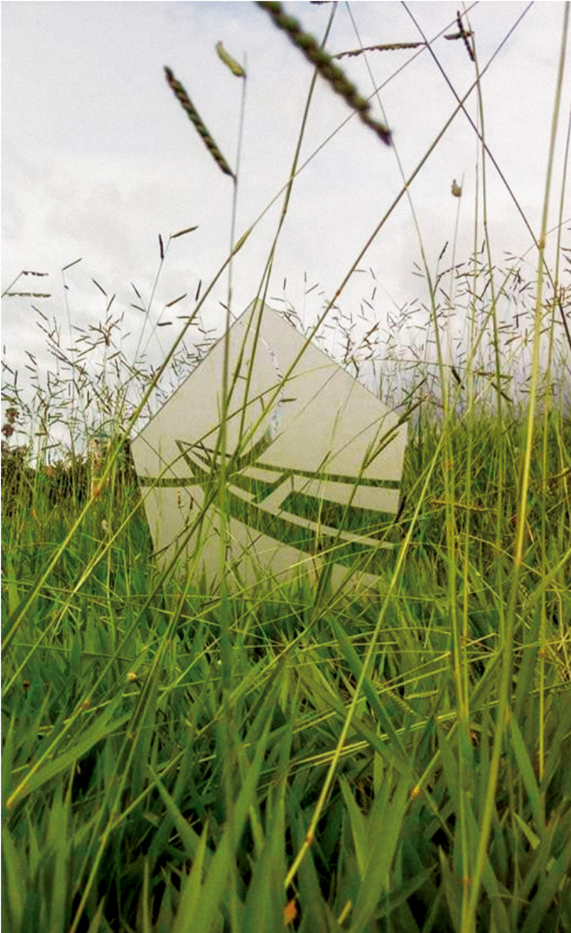
Figura 1. Shambo, F (2017) "De transparencias y opacidades". Instalación. Dibujo sobre lámina de acrílico.