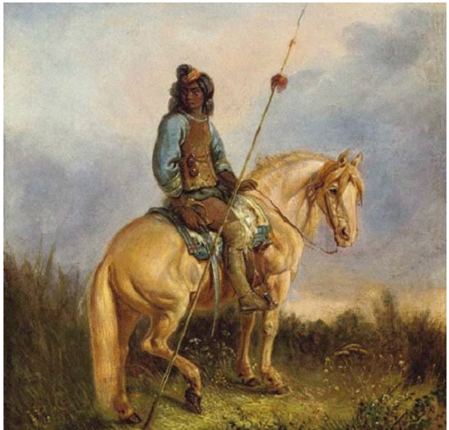
Imagen 2. Cacique pehuenche . Pinturas de Mario Rugendas.