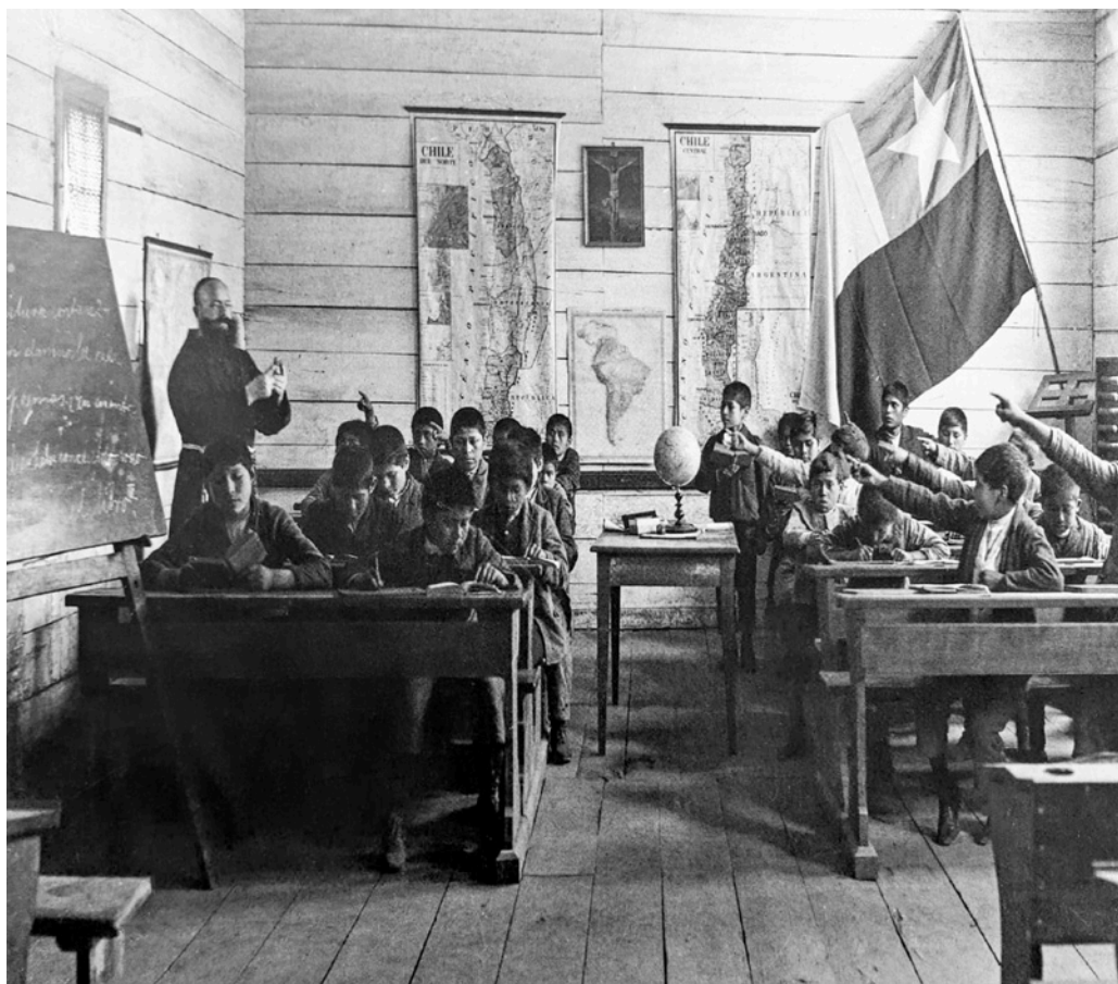
Imagen 3. Aula de una escuela misional.

La metodología utilizada en el análisis de ambas fotografías es de orden cualitativa dividida en dos fases: una es iconográfica y la otra iconológica, de acuerdo a lo propuesto por Panofsky (1979) y actualizado por Lacruz, 2010. En la primera de ellas, se hace una descripción formal de cada foto. Se responde a la