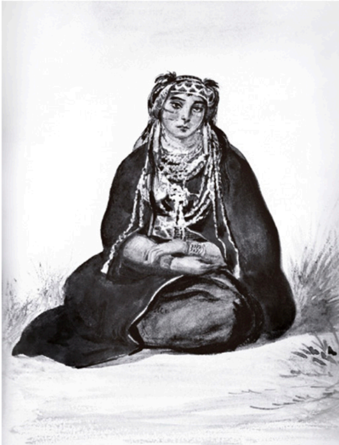
Imagen 1. Mujer araucana . Pinturas de Mario Rugendas.