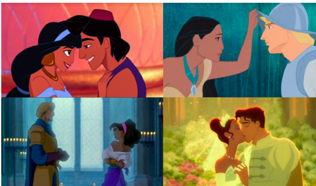
Figura 4. Disney (1992, 1995, 1996 y 2009). Amor interracial y con diferentes razas en Disney. En (de izquierda a derecha y de arriba a abajo) Aladdin (Clements y Musker, 1992), Pocahontas (Pentecost, 1995), El jorobado de Notre Dame (Hahn 1996) y Tiana y el sapo (del Vecho y Lasseter, 2009)