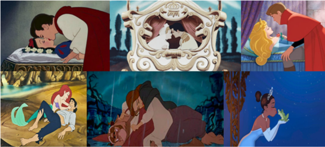
Figura 5. Disney (1937, 1950, 1959, 1989, 1991 y 2009). Evolución de la salvación en el amor romántico Disney. En (de izquierda a derecha y de arriba a abajo) Blancanieves y los siete enanitos (Disney, 1937), La Cenicienta (Disney 1950), La bella durmiente (Disney, 1959), La sirenita (Ashman y Musker, 1989), La bella y la bestia (Hahn, 1991) y Tiana y el sapo (del Vecho y Lasseter, 2009)