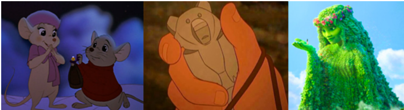
Figura 8. Disney (1990, 2003 y 2016). Ruptura de estereotipos románticos. En (de izquierda a derecha) Los recatadores en Cangurolandia (Schumacher, 1990), Hermano oso (Williams, 2003) y Vaiana (Shurer, 2016)

muestra de afecto con respecto a la propia existencia y al respeto hacia la naturaleza y reino animal.