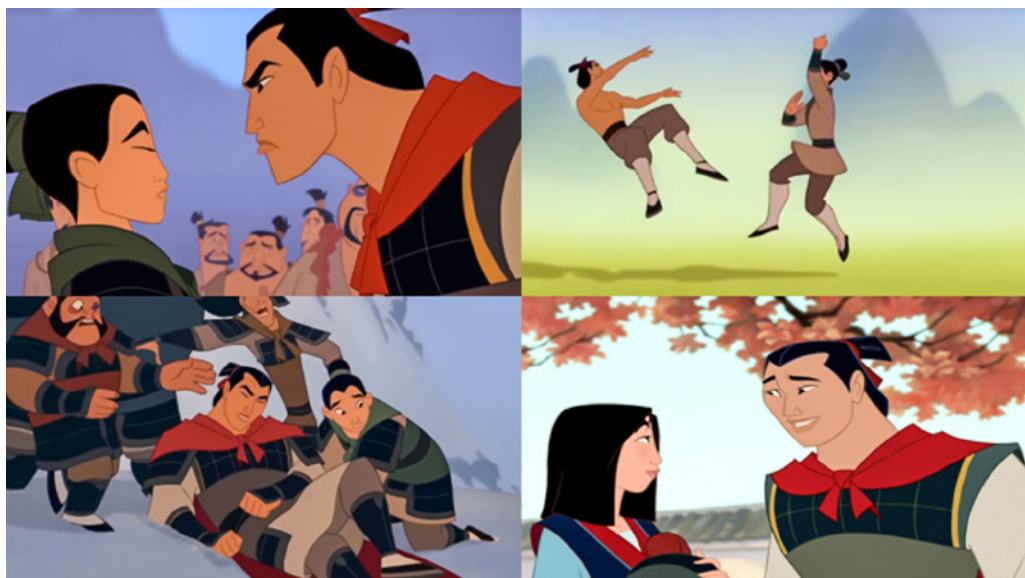
Figura 2. Disney (1998). Proceso de enamoramiento entre Mulan y Shang como ejemplo de pareja diversa. En Mulan (Coats, 1998)