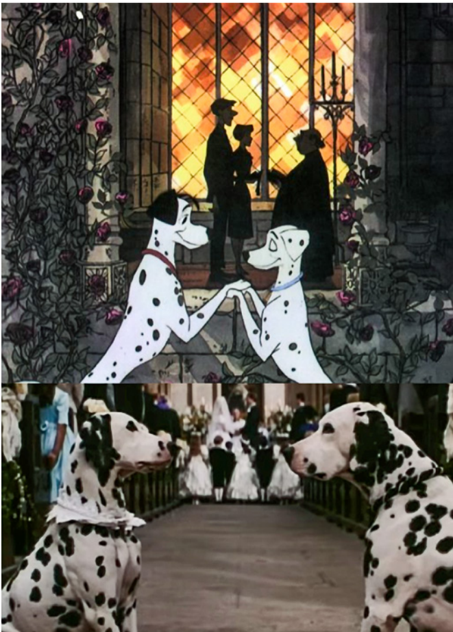
Figura 6. Disney (1961 y 1996). Influencia de la religión en el amor romántico Disney. En (de arriba abajo) 101 dálmatas (Disney, 1961) y 101 dálmatas más vivos que nunca (Hughes y Mestres, 1996)