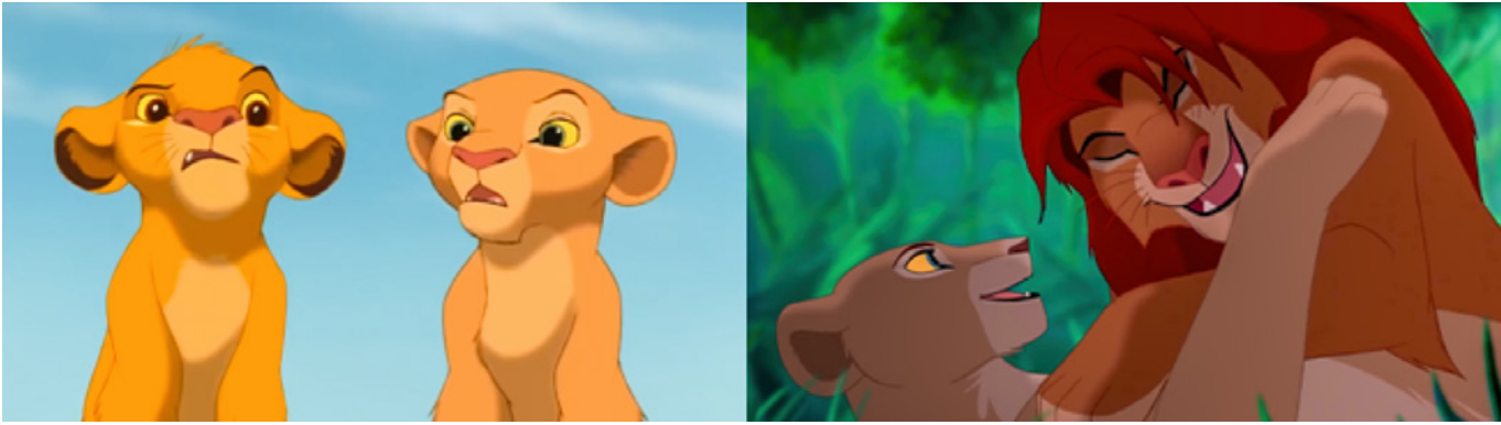
Figura 3. Disney (1994). Simba y Nala como representación de la ruptura de la inmediatez del amor romántico. En El rey león (Hahn, 1994)

eliminación de la infinitud en el sentimiento ya que ella es capaz de enamorarse de otro hombre, en este caso John Rolfe. También, a medida que cambia el momento contextual de producción de los filmes, se modifica la inmediatez del sentimiento (Monleón, 2020b). Por ello, Simba y Nala en El rey león necesitan de un periodo de conocimiento mútuo que se materializa en una amistad durante la infancia; Meg requiere de un tiempo previo para recuperarse de sus traumas amorosos y ser capaz de confiar y enamorarse de Hércules en Hércules . Asimismo, Nick y Judy en Zootrópolis —pese a su condición distante de zorro y coneja respectivamente— inician una relación tras un periodo de conocimiento mutuo y de desarrollo de actividades en conjunto.