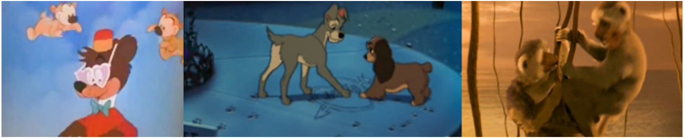
Figura 7. Disney (1947, 1955 y 2000). Estereotipos visuales del amor romántico. En (de izquierda a derecha) Las aventuras de Bongo, Mickey y las judías mágicas (Disney, 1947), La dama y el vagabundo (Disney, 1955) y Dinosaurio (Marsden, 2000)

la relación emergida entre un porquero —Taron— y una princesa —Elena— en Taron y el caldero mágico .