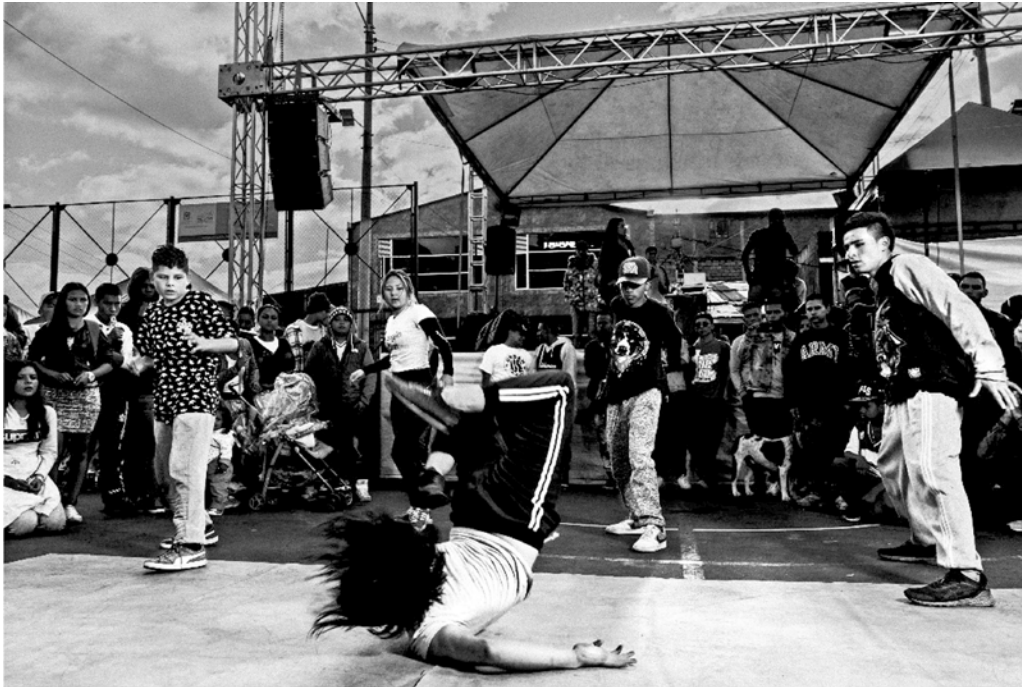
Figura 9. Millán, A, Cortés, L (2018). Fotografía de niños/as adolescentes en muestra de Break dance. Localidad cuarta de San Cristóbal. Bogotá. Col.

música electrónica y el Hip Hop en diversos barrios del sur de la ciudad. El rap, es un movimiento contracultural que es crítico contra la injusticia social, contra la violencia, la intolerancia, la limpieza social. Los jóvenes sienten un alivio frente a una situación de inequidad. (Angola, 2018).