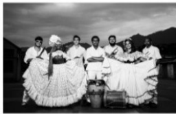
Fundación Reina Africana