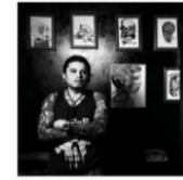
Tatuador BARRIO VEINTE DE JULIO