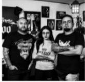
Tatuadores BAZAR DEL VEINTE DE JULIO