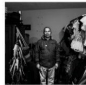
Arnedis Rancero Fundación