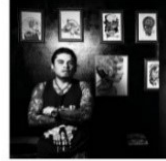
Tatuador BARRIO VEINTE DE JULIO