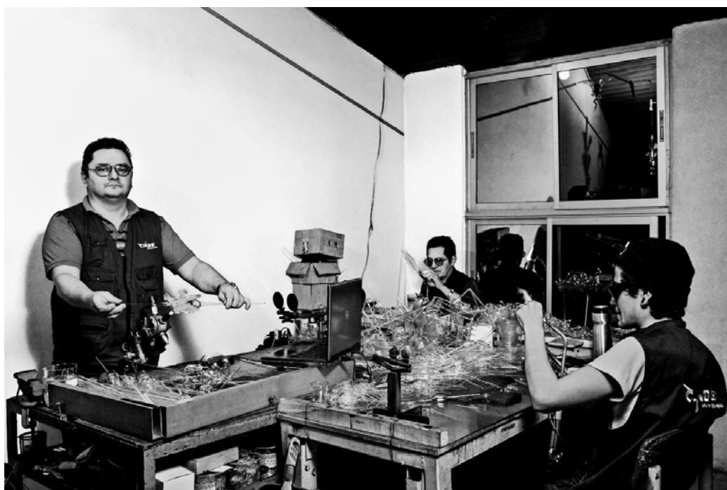
Figura 5. Millán, A, Cortés, L (2018) Fotografía en el Taller de vidrio Hermanos Conde. Localidad Cuarta de San Cristóbal. Bogotá. Col.

En el Museo comunitario del vidrio hay una conjunción entre prácticas artísticas, rescate a la memoria de una