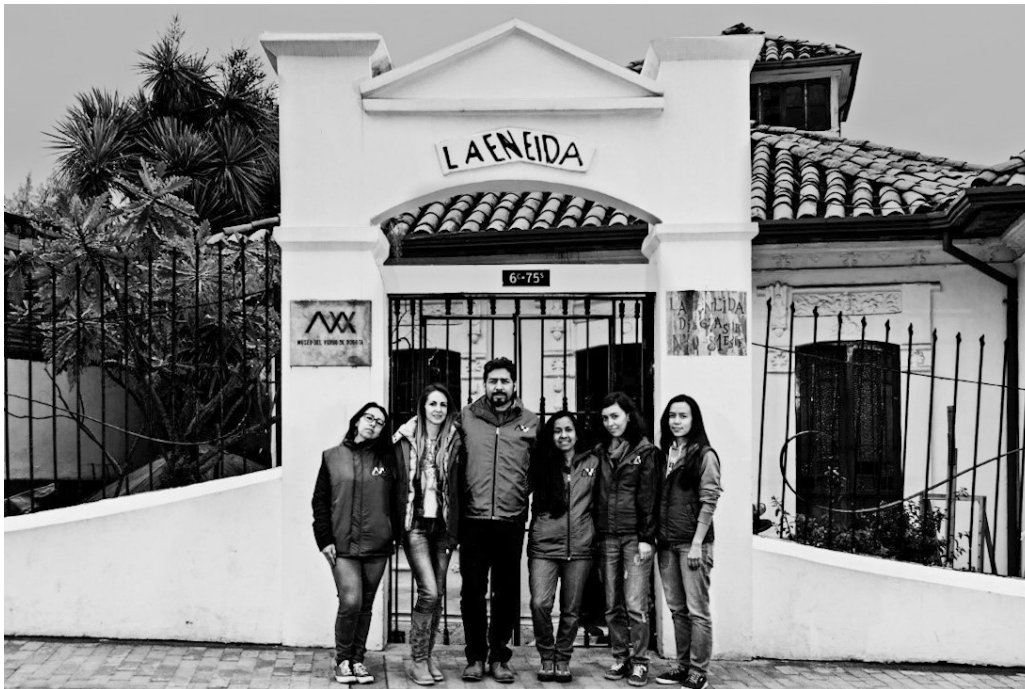
Figura 6. Millán, A; Cortés, L (2018). Fotografía del equipo del Museo del Vidrio en su sede la Hacienda de la Eneida. Localidad Cuarta de San Cristóbal. Bogotá, Colombia.

práctica artesanal, como lo es el vidrio y la búsqueda en la defensa del patrimonio material e inmaterial, en un trabajo comunitario, que encuentra en los artesanos y su memoria una forma de restauración del tejido social en relación con las artes del fuego .