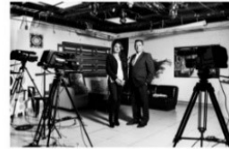
Colcable TV COMUNITARIA