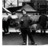
Presidenta MESA DE GRABTI SAN CRISTÓBAL