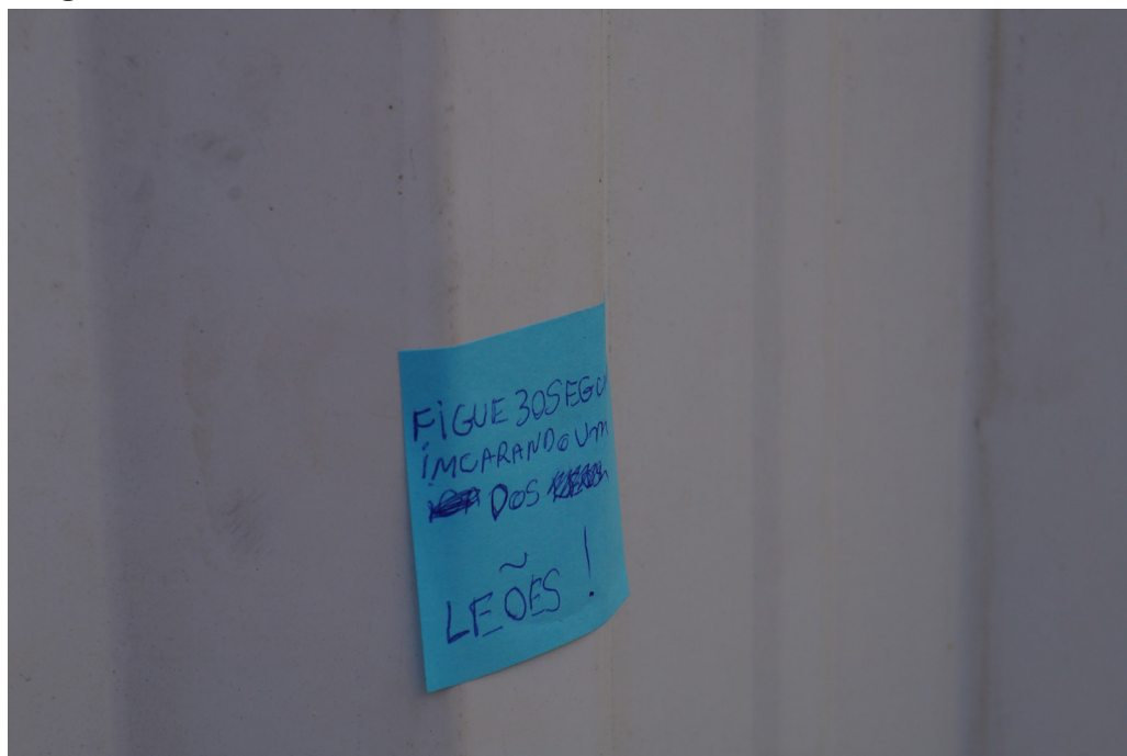
Post-it azul com os dizeres: “Fique 30 segundos encarando um dos leões!”