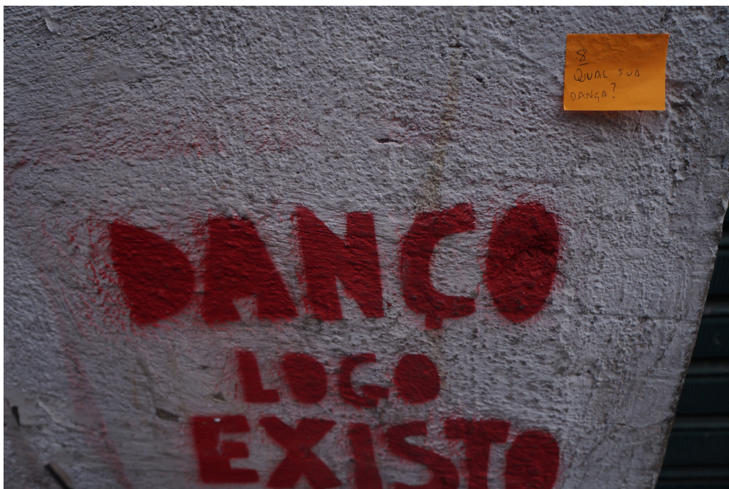
Ao lado dos dizeres no muro que afirmam “Danço, logo existo”, há um post-it colado que nos pergunta: “Qual sua dança?”