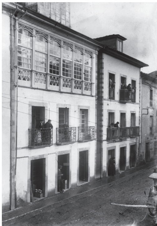
Las casas de Villamil (a la izquierda) y de Gómez, o casa del Médico (a la derecha), en la plaza de la Refierta (hoy, de Mario Gómez), Cangas de Tineo, hacia 1900.

se persigan, si la cooperación es nutrida y entusiasta, el éxito es indudable. Todos sabéis que un pequeño sacrificio realizado entre muchos, multiplica las eficacias y los frutos obtenidos son siempre espléndidos.