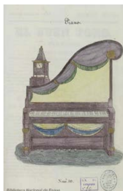
Imagen 3. Grabado de un piano, nº 10, de 31 de mayo de 1839.

En el número 9, de 15 de mayo, aparece un curioso dibujo titulado “Artes”, que representa el monumento al pueblo de Madrid que el 2 de mayo de 1808 se levantó contra los franceses invasores, como refleja la inscripción del grabado.