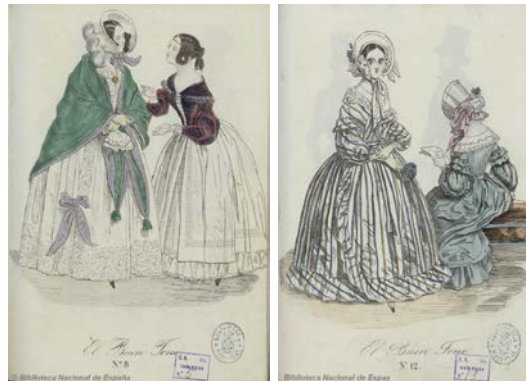
Imagen 6. Grabados de dos damas. El Buen Tono , nº 8, 30 de abril, y nº 12, 30 de junio de 1839.

encontramos dos parejas de mujeres en los números 8 y 12; un hombre y una mujer en los 9, 10 y 11 y, finalmente, dos parejas de hombres en los 8 y 12.