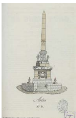
Imagen 4. Grabado del monumento al 2 de mayo de 1808. El Buen Tono , nº 9, 15 de mayo de 1839.

En el número 9, de 15 de mayo, aparece un curioso dibujo titulado “Artes”, que representa el monumento al pueblo de Madrid que el 2 de mayo de 1808 se levantó contra los franceses invasores, como refleja la inscripción del grabado.