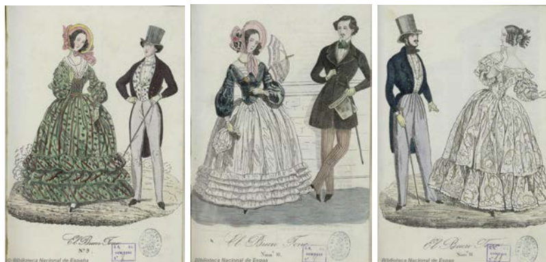
Imagen 7. Grabados de dama y caballero. El Buen Tono , nº 9, 15 de mayo; nº 10, 31 de mayo; nº 11, 15 de junio de 1839.