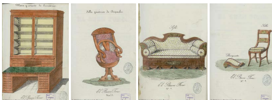
Imagen 2. Grabados de los números 5 y 7.

reciben los grabados que después reproducen. Estos los conocer porque “seis son los periódicos de que tenemos noticias [que] se publican en París con figurines (...), y últimamente llegados hemos elegido los que se acompañan en el presente número” 9 ; así irán haciendo conforme los reciban. Ofrecen láminas de mobiliario porque a este tema “deben estar iniciadas las señoras; pues como encargadas de la parte doméstica, á su inspección ó cargo está el arreglo y ornato de la casa” 10 .