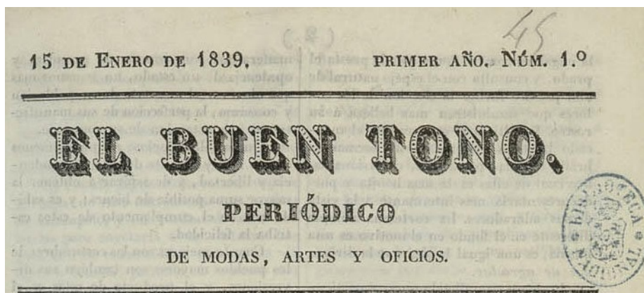
Imagen 1. Cabecera del primer número del periódico. El Buen Tono , nº 1, 15 de enero de 1839, p. 1.