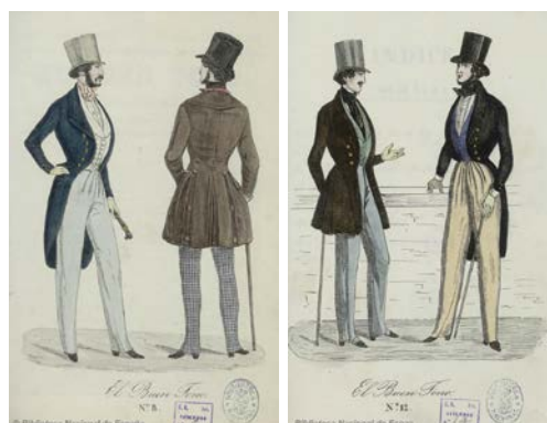
Imagen 8. Grabados de parejas de hombres. El Buen Tono , nº 8, 30 de abril, y nº 12, 20 de junio de 1839.