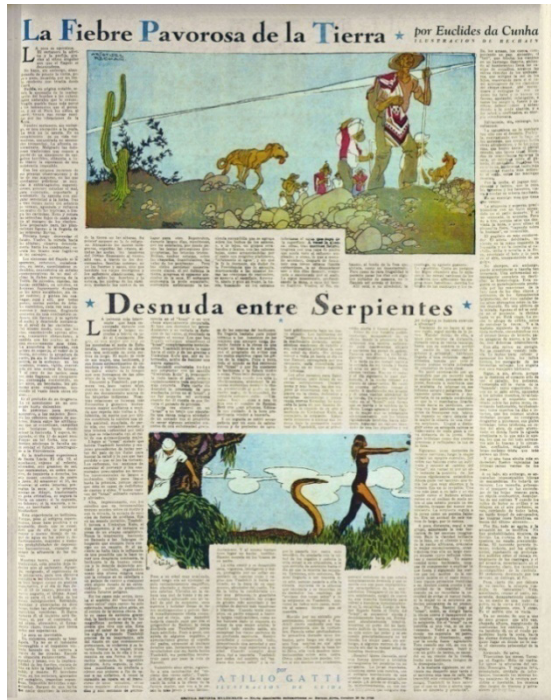
Figura 2 – Euclides da Cunha “La fiebre pavorosa de la tierra” RMS n° 12 (28 de octubre de 1933)

La fusión entre religiosidad y superstición estuvo presente también en la última versión que el suplemento ofreció de Os Sertões , titulada “Cómo se hace un monstruo”. Este relato comenzaba in medias res con puntos suspensivos, signos que abundaban en los primeros párrafos, enfatizando el carácter fragmentario de la historia: