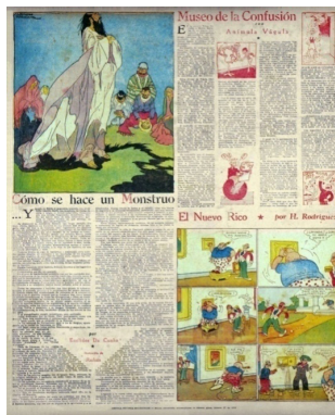
Figura 3 – Euclides da Cunha “Cómo se hace un monstruo” RMS n° 28 (10 de marzo de 1934)

Al igual que en los fragmentos anteriormente analizados, texto e imagen aclimataban la traducción al público local. 14 Mediante la implementación de voces testimoniales similares a las que habían integrado los reportajes del diario, se identificaba a los habitantes del sertão con los gauchos de Argentina: “Un viejo criollo detenido en Canudos en los últimos días de la campaña, algo me dijo a su respecto ” (1934, 7 cursiva mía).