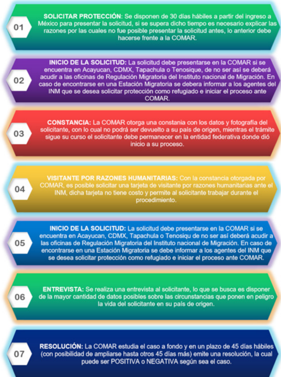
Tabla 6. Pasos para solicitar asilo en México