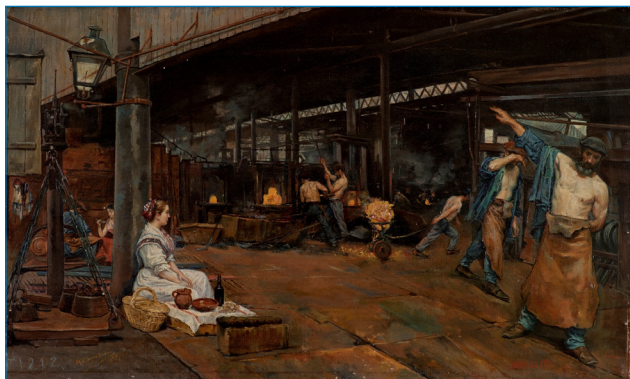
Figura 6. Las doce en los Altos Hornos , óleo sobre lienzo (Alto: 43 cm; Ancho: 84 cm), de Manuel Villegas Brieva (Lérida, 1871 – Madrid, 1923), 1895.

La pintura titulada Las doce en los Altos Hornos (Figura 6) fue realizada en 1895, corriendo la última década del convulso siglo XIX español, tras décadas de industrialización tardía y desigual en la España decimonónica. Ese año es muy posterior al inicio de la Revolución Industrial en Inglaterra o Primera Revolución Industrial (29 de abril de 1769, fecha de la primera patente