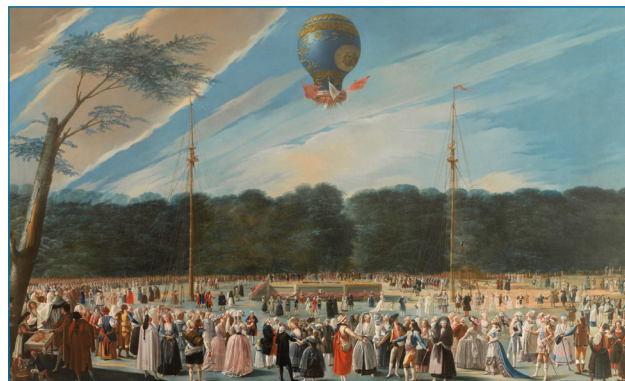
Figura 7. Ascensión de un globo Montgolfier en Aranjuez , óleo sobre lienzo (Alto: 169 cm; Ancho: 279,5 cm), de Antonio Carnicero Mancio (Salamanca, 1748 – Madrid, 1814), hacia 1784. Fuente: MNP, núm. catálogo P641, Sala 089; fotografía para uso personal

En España, hubo ascensiones tripuladas en aerostatos de hidrógeno en el reinado de Carlos IV. La primera fue la del capitán italiano Vizenzo Lunardi en Madrid, el domingo 12 de agosto de 1792 y la segunda el martes 8 de enero de 1793, que fueron presenciadas por la Familia Real, Godoy y Álvarez de Faria, y numeroso público que dejó beneficios económicos al Hospital General de