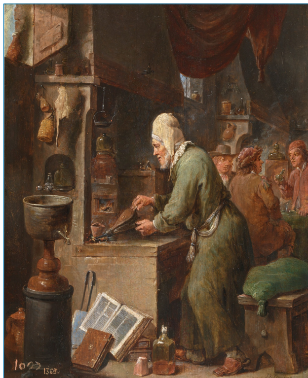
Figura 4. El Alquimista, óleo sobre tabla (Alto: 32 cm; Ancho: 25 cm), de David Teniers (Amberes, 1610 – Bruselas, 1690), fecha 1631-1640.

Concerniente a la Alquimia (etapa de la Química del siglo IV a. C. al 1500, aproximadamente), en la pintura titulada El Alquimista (Figura 4), de David Teniers (hijo) representa en primer plano la escena del alquimista insuflando aire con un fuelle para avivar la combustión del carbón en el horno o fogón, teniendo a su izquierda una alquitara (alambique). En segundo plano figuran tres personas, dos de ellas parecen ser visitantes y la tercera un ayudante del alquimista mostrando un producto contenido en un recipiente de vidrio. La luz de las ventanas indica que es de día.