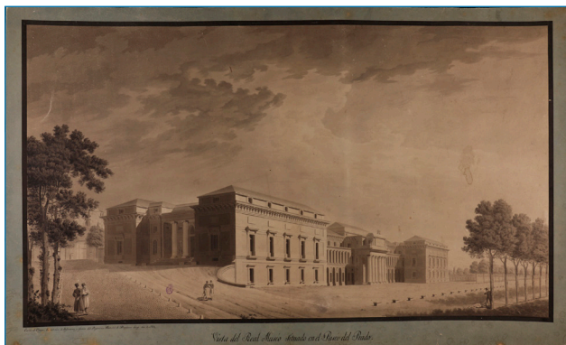
Figura 1. Vistas de las fachadas norte (hoy, de Goya) y principal (hoy, oeste o de Velázquez) del edificio del MNP de Madrid (hoy, edificio Villanueva). Fuente: “Vista del Museo del Prado”, de Carlos de Vargas Machuca, dibujo (papel agarbanzado sobre cartulina, tinta y aguada gris), 1824. Madrid, Real Academia de Bellas Artes de San Fernando, A-5415