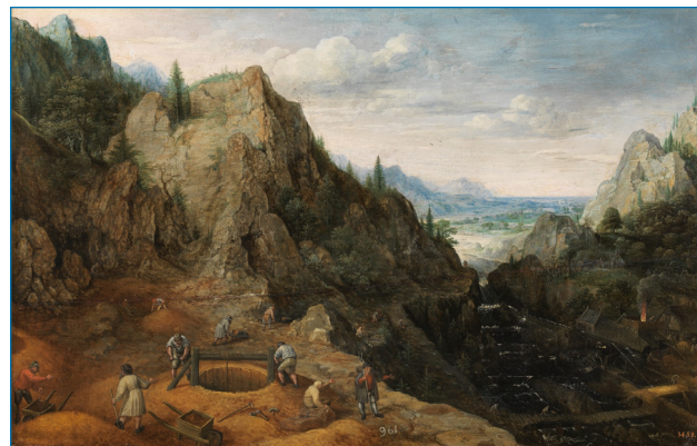
Figura 5. Paisaje con ferrerías , óleo sobre tabla (Alto: 41 cm; Ancho: 64 cm), de Lucas van Valckenborch (Lovaina, 1535 – Fráncfort, 1597), 1595.

La pintura titulada Paisaje con ferrerías (Figura 5), de autor belga, es una vista general de ferrerías; fue pintada en 1595, es decir, en un tiempo de conocimientos metalúrgicos mucho más próximo al final de la Alquimia que a la época de Lavoisier. En la tabla pictórica se puede observar un pozo y la actividad laboral característica de extracción y transporte del mineral de hierro en carretillas, el sistema hidráulico y el conjunto