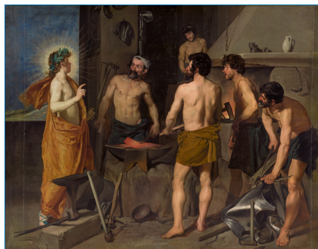
Figura 2. La Fragua de Vulcano , óleo sobre lienzo (Alto: 223 cm; Ancho: 290 cm), de Velázquez, 1630. Fuente: MNP, núm. catálogo P1171, Sala 011; fotografía para uso personal

A título de ejemplo, se comenta brevemente la composición y estructura de la Fragua de Vulcano , óleo sobre lienzo de Diego Rodríguez de Silva y Velázquez (Sevilla, 1599 – Madrid, 1660), [14] conocido como Velázquez, pintura muy famosa del MNP. Nos dice la Guía del Prado más reciente que la pintura (Figura 2) fue realizada en el primer viaje del pintor a Italia (1629-1630), mostrando