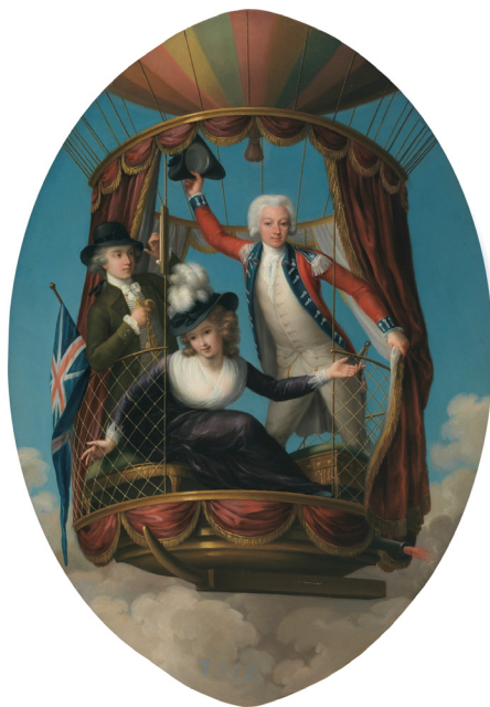
Figura 8. Los tres viajeros favoritos , óleo sobre lámina de cobre (Alto: 50,5 cm; Ancho: 36,5 cm), de John-Francis Rigaud (Turín, 1742 – Packington Hall, 1810), hacia 1785. Fuente: MNP, núm. catálogo P002598, Sala 089; fotografía para uso personal

alumnos del Real Colegio de Artillería de Segovia, asesorados por él, construyeron un aerostato de 45 m de diámetro y 93 m de largo. Tras experimentación previa, ascendió con éxito los días 3, 5 y 7 de noviembre de 1792. A petición de la Familia Real, se realizó una demostración con éxito en San Lorenzo de El Escorial el 14 de noviembre de ese año, acto en el que intervino el capitán Proust; el conde de Aranda fue testigo y escribió un informe laudatorio. [38]