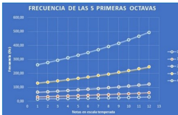
Figura 6. Frecuencia de las notas de las primeras octavas de la escala temperada. Se aprecia la no linealidad en la progresión de frecuencias

Se puede proponer a los alumnos que dibujen una tabla, por ejemplo empezando en Fa 1, y que contenga 3 octavas y dos notas más, agudas. Entonces, debe destacarse que es fundamental que cada octava tenga 12 notas y que