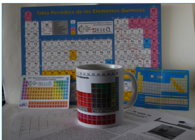
Figura 1. Algunas tablas periódicas incluida una taza decorada con ella

© 2020 Real Sociedad Española de Química