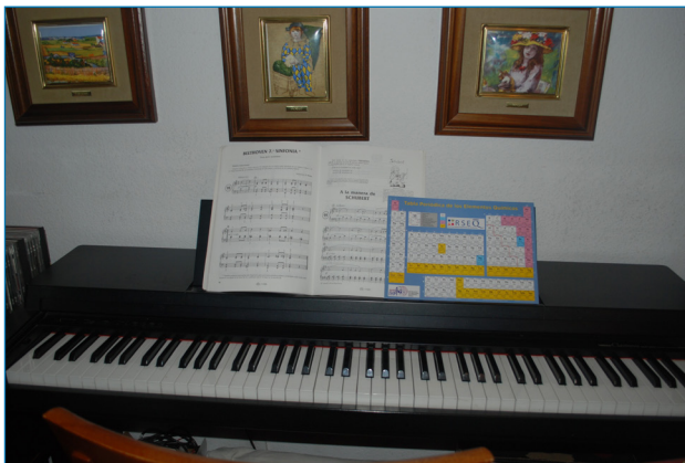
Figura 5. Teclado de un piano electrónico de 88 teclas. El mecanismo de producción de sonido es diferente del tradicional pero el teclado es el mismo

Si “aserramos” mentalmente las cinco octavas y las alineamos como en la Figura 4, con un poco de imaginación tenemos una tabla periódica musical gráfica. Cada fila sería una octava (un período) y cada columna un grupo, en él