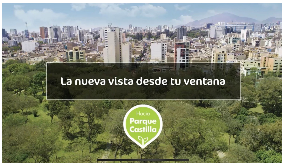
IMAGEN 2. GRUPO INMOBILIARIO PRO CITY ▶ Publicidad del Edificio Liberty en Lince, Lima, Perú. “Nuevo Proyecto en Lince, Edificio Liberty”, folleto.

ser presentado como un lugar tranquilo y silencioso (véase la imagen 2). Así lo manifestó un agente de bienes raíces: “nuestros clientes aprecian [...] que nuestro proyecto esté cerca al Parque Castilla. Para muchos significa escapar del ruido de la ciudad y al volver a casa pueden disfrutar de un lugar tranquilo” (entrevista con agente de bienes raíces, Lima, 1 de febrero de 2019).