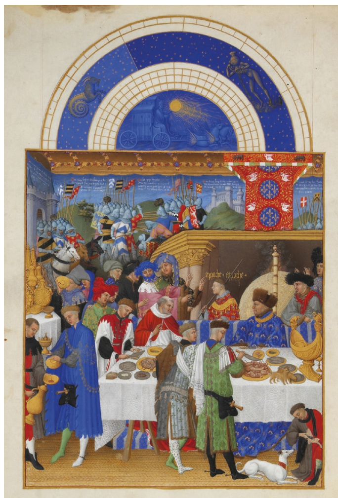
Figura 2. «Mes de enero», Muy Ricas Horas del duque de Berry , Hermanos Limbourg. c. 1412-1416, Bibliothèque du Château de Chantilly, Ms. 65, fol. 1v

1535 se registran las siguientes: el jueves 30 de julio de 1528 comió, cenó y pernoctó en esta villa y el 31 de julio, después de comer, marchó para Sigüenza. 41 Del mismo modo, el martes 16 de marzo de 1529, había cenado y pernoctado en Medinaceli y, tras almorzar, al día siguiente marchó para Eriza. 42 Entre las posteriores, el rey pernoctó en Medinaceli el martes 6 de marzo de 1543, siendo recibido por el duque don Juan y la duquesa doña María. 43