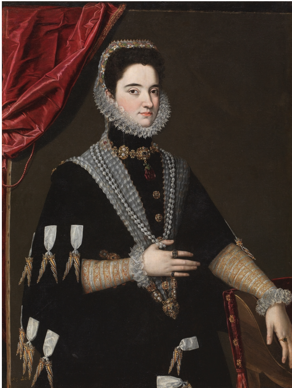
Figura 3. Retrato de Dama , detalle del joyel, Scipione Pulzone, 1585, 113 x 85 cm, óleo sobre lienzo, Museo Nacional del Prado, Madrid. (Inv. P001029)