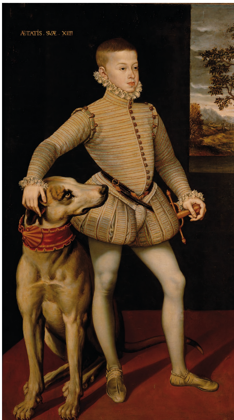
Figura 5. Retrato del archiduque Alberto VII , Alonso Sánchez Coello, c. 1573, 164 x 98 cm, óleo sobre lienzo, Kunsthistorisches Museum, Viena, Gemäldegalerie, 9699