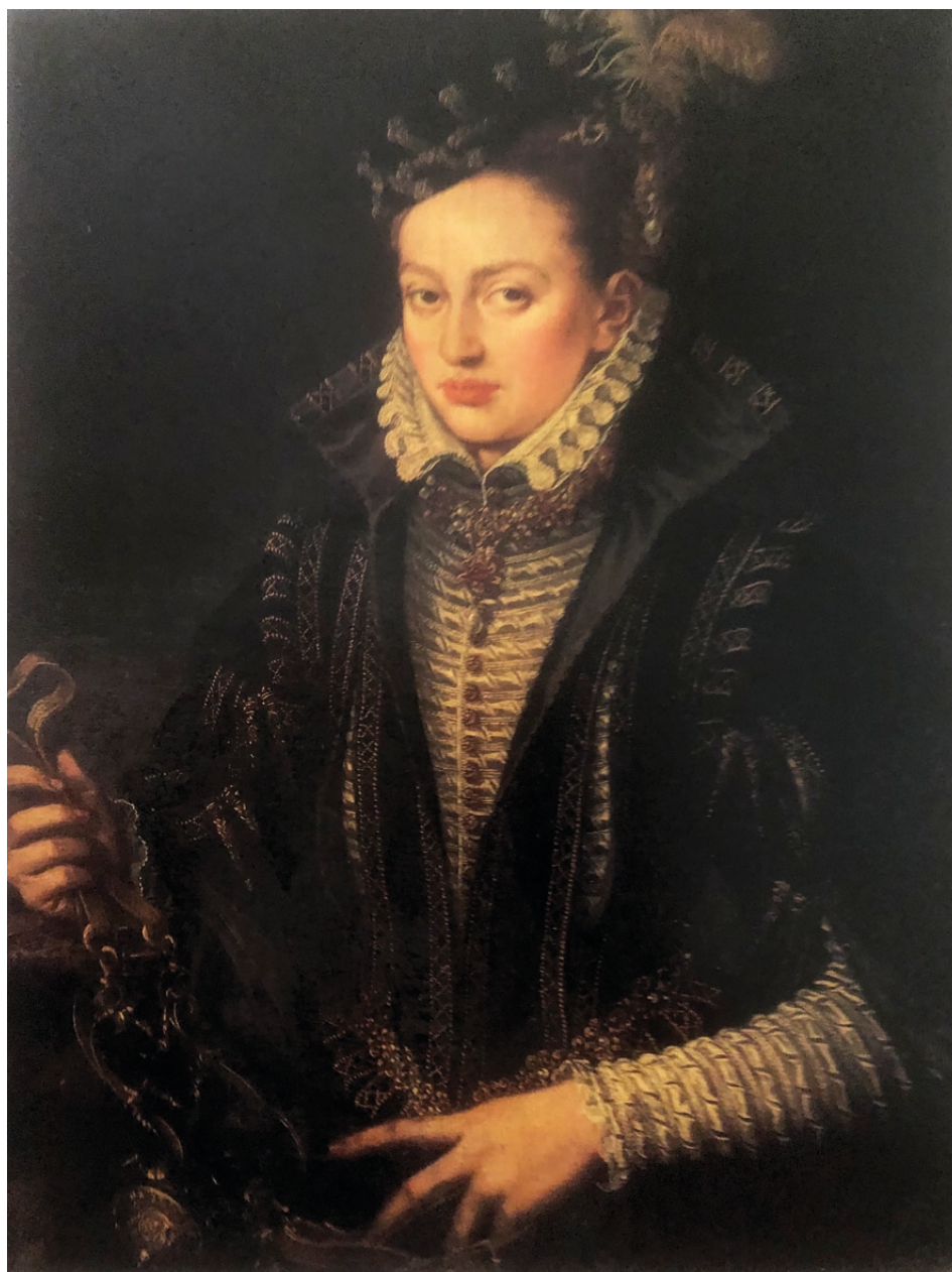
Figura 4. Retrato de Juana de Portugal , Alonso Sánchez Coello, 1553, óleo sobre lienzo, Embajada de Bélgica, Madrid