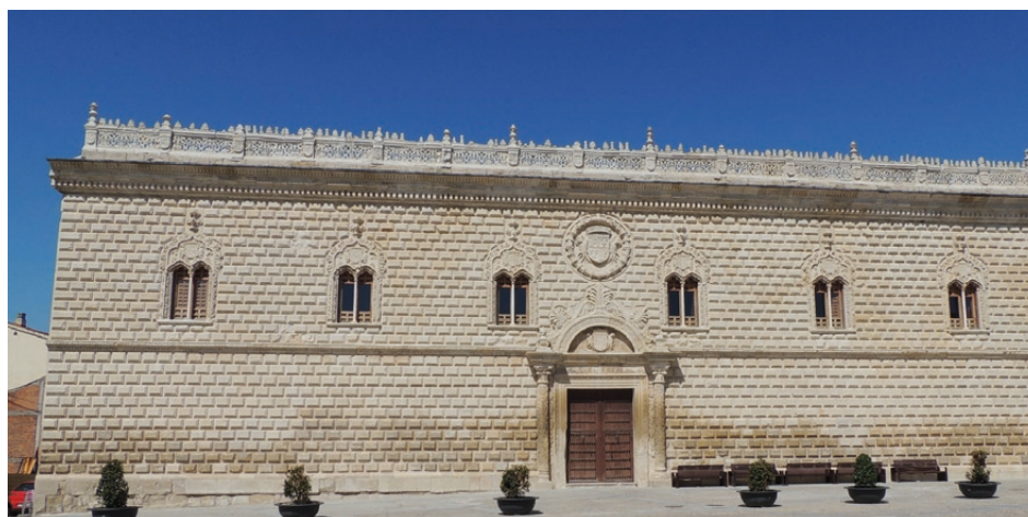
Figura 1. Palacio de Cogolludo, Guadalajara, ¿Lorenzo Vázquez de Segovia? c. 1490

Fue en estos marcos arquitectónicos en los que se hizo uso de unos objetos suntuarios tales como tapices, joyas, vajillas, orfebrerías, etc., trasladados de un lugar a otro con el señor de la casa, que necesitaron de un conjunto de servidores que los acomodaran y mantuvieran. Así, no se puede concebir el uso y la exhibición de las vajillas de plata y oro sin la figura del repostero de plata, el empleo de los cojines en habitaciones y estrados sin la presencia de los pajes, el aderezo de los caballos sin los mozos de cuadra o el traslado de estas piezas sin la presencia del acemilero mayor, por poner solo unos ejemplos. Es por ello por lo que, en mi opinión, resulta indispensable abordar el estudio de una determinada Casa y Corte desde un punto de vista holístico, pues ni se trata de estudiar las piezas artísticas descontextualizadas, ni de presentar solo la relación de servidores, pues aporta escaso valor en términos interpretativos o de la relevancia que tuvieron estas piezas como «artefactos culturales». 12 Además, resulta necesario acercarse a este fenómeno desde un punto de vista transgeneracional, pues muchas de estas piezas tuvieron un valor material e inmaterial con capacidad para conectar a los miembros del linaje con sus antepasados cercanos o remotos. 13