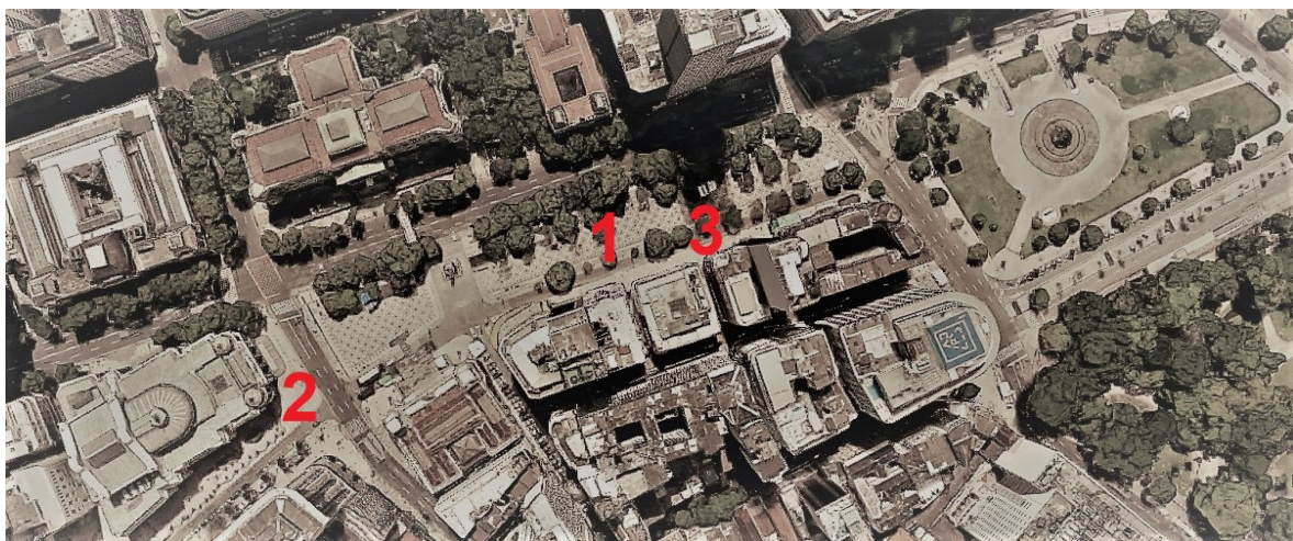
Figura 05: Em (1), a posição original do busto, no centro da praça, entre o antigo Cine Pathé (atualmente, uma igreja evangélica) e o Supremo Tribunal Federal (atual Centro Cultural da Justiça Federal); em (2), a posição provisória ocupada durante a construção da linha do metrô, ao lado do Teatro Municipal, entre 1972 e 1976; e em 3, a nova posição após as obras do Rio Cidade, na lateral da praça, em frente à rua Francisco Serrador.