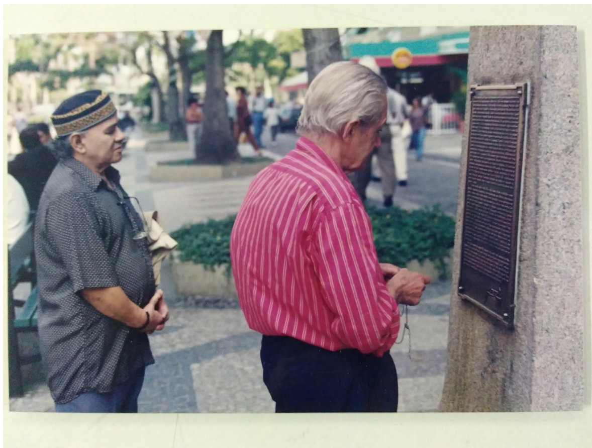
Figuras 06 e 07: O busto em sua atual localização, na lateral da praça. Na ocasião (1999), o monumento recebia as homenagens pelos 45 anos da morte de Vargas, enquanto pessoas faziam suas orações e reflexões diante da carta-testamento.

A progressiva invisibilização do tradicional lugar de memória do trabalhismo getulista coincidiu com o processo de afirmação do receituário neoliberal como paradigma da vida econômica, política e cultural do país. Quando, no seu famoso discurso de despedida do Senado em dezembro de 1994, o presidente eleito Fernando Henrique Cardoso prometeu o fim da “Era Vargas”, também expressou o quanto as estratégias de desenvolvimento nacional que a caracterizavam estavam em desalinho com o estágio neoliberal do capitalismo (CARDOSO, 1995).