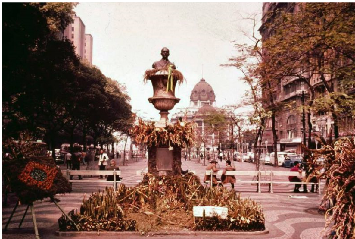
Figura 01: Primeira localização do busto de Vargas na Cinelândia, ainda sobre o vaso de mármore. Ao fundo, o Palácio Monroe, sede do Senado Federal. S.d.

No dia 24 de agosto de 1954, um busto de bronze retratando o presidente Getúlio Vargas apareceu na praça Marechal Floriano, mais conhecida como Cinelândia, no centro do Rio de Janeiro. Na manhã daquele mesmo dia, Getúlio havia se suicidado em seu quarto no Palácio do Catete, fato que causou imensa comoção popular em todo o país.