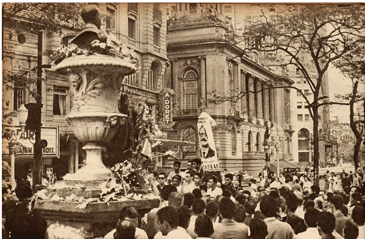
Figura 04: Reunião em frente ao busto de Getúlio Vargas em 25 de agosto de 1961, no dia da renúncia do presidente Jânio Quadros.