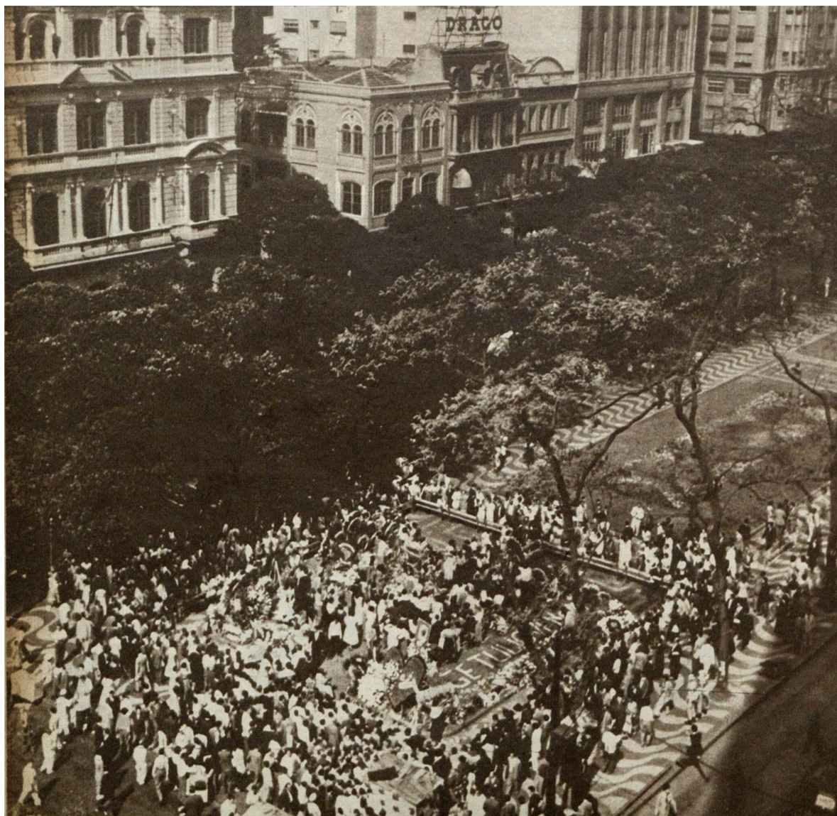
Figura 03: Aspecto da concentração de pessoas ao redor do busto de Vargas, no dia 25 de agosto de 1955.

Da parte dos veículos trabalhistas, como o jornal “Última Hora”, as homenagens ao redor do busto da Cinelândia representavam um povo ordeiro, leal, movido por sentimentos cristãos, exemplos do trabalhador ideal getulista. A ênfase dada às demonstrações de carinho, gratidão e admiração, oriundas de pessoas descritas como humildes, simples e trabalhadoras, reforçava a imagem de Getúlio Vargas como "pai dos pobres".