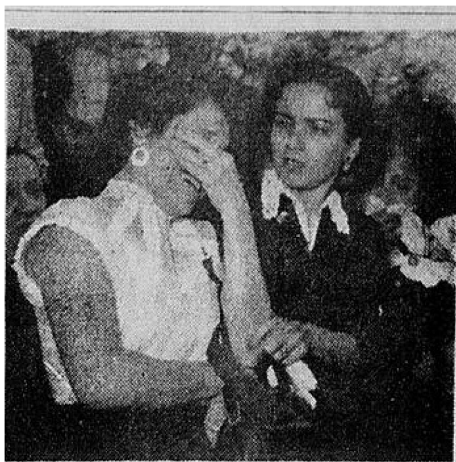
Um ano depois... e as explosões de sensibilidade ainda tomaram conta de quantos reverenciaram a memória do grande Presidente Getúlio Vargas