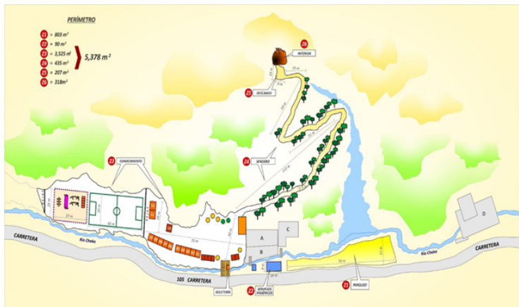
Figura 2. Zonas de distribución del atractivo

El número máximo de visitas que se debe permitir en la gruta de Huagapo considerando las características físicas y su capacidad de manejo es de 483 visitantes al día.