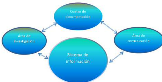
Figura N° 1. Estructura básica de un observatorio