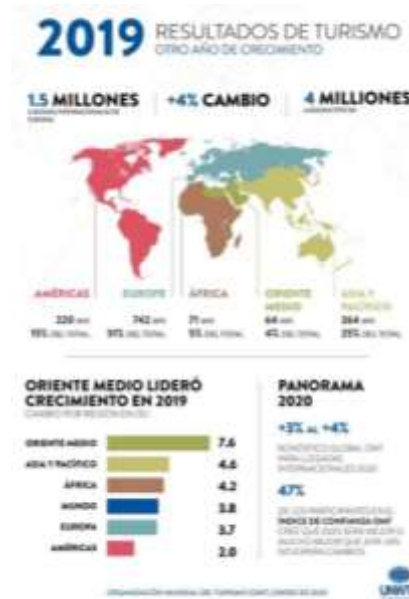
Figura 1: Resultados de turismo 2019