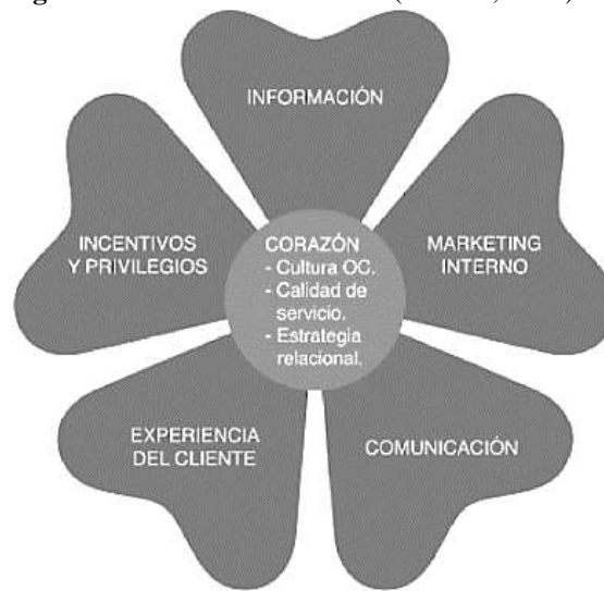
Figura 2: Trébol de fidelización (Alcaide, 2016).

La información se refiere a conocer al cliente, a través de diferentes métodos, para entender sus deseos y expectativas. El marketing interno es la implantación eficaz de estrategias de marketing dentro del negocio. La comunicación hace énfasis en entablar una relación estable, hasta emocional con el cliente. La experiencia del cliente trata de generar en la memoria del cliente una experiencia duradera y agradable. Los incentivos y privilegios son las recompensas que recibe el cliente por la fidelidad que ha presentado.