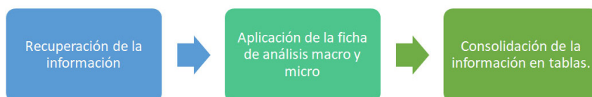
Figura 2: Fases del análisis crítico del discurso

Urta y Sandoval (2018, p. 200) sostienen que “se diferencia de los otros enfoques porque no solo describe e interpreta los discursos en sus contextos, sino que ofrece una explicación del por qué y cómo el discurso opera”. El ACD se desarrolló durante tres momentos (Figura 2).